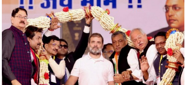
राहुल गांधी से अनुरोध किया कि आप अन्य राज्यों की तरह बिहार को भी ज्यादा समय देने की कृपा करें। हमारा बिहार के कांग्रेसजन के तर्फ से यह आग्रह है कि आप बिहार को ज्यादा समय देते तो हम राज्य में कांग्रेस को वापस मजबूती से खड़ा करके दिखाएंगे।