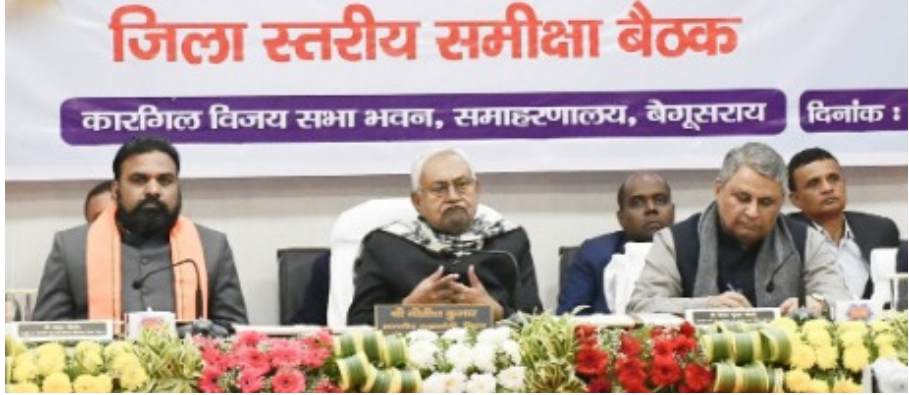
जिला स्तरीय समीक्षा बैठक कारगिरी विजय सभा भवन, समाहरणालय, बेगूसराय दिनांक :

मुख्यमंत्री नीतीश कुमार ने शनिवार को प्रगति यात्रा के तीसरे चरण में बेगूसराय जिले में चल रही विकास कार्ययोजनाओं के संबंध में समाहरणालय स्थित कारगिरी विजय सभा भवन में समीक्षात्मक बैठक की। समीक्षात्मक बैठक में बेगूसराय के जिलाधिकारी तुषार सिंगला ने जिले के विकास कार्यों का प्रस्तुतीकरण के माध्यम से विस्तृत जानकारी दी। बैठक को संबोधित करते हुए मुख्यमंत्री ने कहा कि जिलाधिकारी ने जिले में चल रही विकास कार्ययोजनाओं की जानकारी यहां हम सभी को दी है। यहां उपस्थित जन प्रतिनिधियों ने भी अपनी-अपनी बातें रखी हैं। अधिकारीगण आपकी समस्याओं को गंभीरतापूर्वक विचार कर उसका निराकरण करेंगे। हम लोगों ने प्रारंभ से ही बिहार के हर क्षेत्र में विकास के लिए काम किया है। प्रगति यात्रा के क्रम में विभिन्न जिलों का दौरा कर विकास कार्ययोजनाओं को हम देख रहे हैं। लोगों से बातचीत भी कर रहे हैं। जो भी समस्याएं या आवश्यकताएं हैं उन्हें आगामी बिहार विधानसभा सत्र के पहले ही कैबिनेट की बैठक में स्वीकृति दे दी जाएगी।