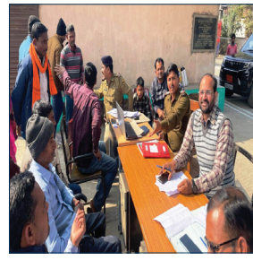
प्रातः किरण संवाददाता

कुर्था (अरवल) राज्य सरकार के निर्देश पर भूमि विवाद को लेकर आए दिन राज्य के विभिन्न जिलों प्रखंडों का गांव में हो रहे खून खराबे मारपीट व आपसी विवाद को लेकर राज्य के सभी जिले व प्रखंड के सभी थानों में थानाध्यक्ष व सीओ के नेतृत्व में जनता दरबार लगाने का निर्देश दी गई थी ताकि भूमि विवाद जैसे मामले को काम किया जा सके इसी के कड़ी में शनिवार को कुर्था थाने एवं मानिकपुर थाने में जनता दरबार का आयोजन