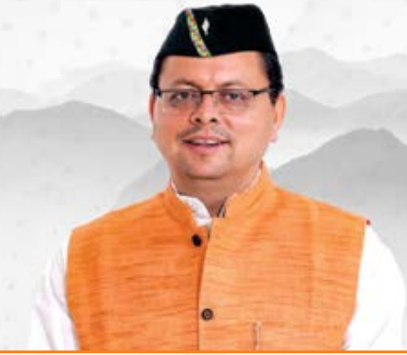
पुष्कर सिंह धामी मुख्यमंत्री, उत्तराखण्ड