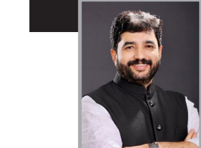
मुरलीधर मोहोल केन्द्रीय सहकारिता एवं नागरिक उड्डयन राज्य मंत्री

जिससे महिलाओं को आर्थिक स्वतंत्रता प्राप्त करने में मदद मिलती है और अर्थव्यवस्था में उनकी भूमिका और मजबूत होती है। सहकारी मॉडल को बढ़ावा देने में भारत का नेतृत्व भारत ने लंबे समय से आर्थिक परिवर्तन और सामाजिक प्रगति को बढ़ावा देने के साधन के रूप में सहकारी समितियों के मूल्य को पहचाना है। नई दिल्ली में आयोजित कठअ वैश्विक सहकारी सम्मेलन के कार्यक्रम में प्रधानमंत्री श्री नरेन्द्र मोदी जी की उपस्थिति ने सहकारी आंदोलन के प्रति भारत की गहरी प्रतिबद्धता को उजागर किया है। अंतर्राष्ट्रीय सहकारिता वर्ष 2025 के शुभारंभ के दौरान उनके संबोधन ने एक आत्मनिर्भर, समृद्ध राष्ट्र के निर्माण में सहकारिता की भूमिका को रेखांकित किया।