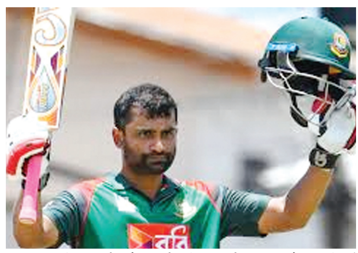
का आगाज किया। तमीम ने फरवरी 2007 में जिम्बाब्वे के खिलाफ वनडे मैच से अपने इंटरनेशनल करियर का आगाज किया। तमीम का इंटरनेशनल रिकॉर्ड 2007 में जिम्बाब्वे के खिलाफ वनडे मैच में 70 टेस्ट मैचों में 38.89 के एवरेज से 5134 रन बनाए।

नई दिल्ली, एजेंसी। बांग्लादेश के पूर्व कप्तान तमीम इकबाल ने फिर इंटरनेशनल क्रिकेट से संन्यास ले लिया है। यह दूसरी बार है जब उन्होंने अपने करियर को अलविदा कहा है। तमीम ने जुलाई 2023 में भी इंटरनेशनल क्रिकेट से संन्यास लिया था, लेकिन 24 घंटे के भीतर ही अपना फैसला बदल दिया था। तमीम ने हाल ही में नेशनल सेलेक्शन पैनल से मुलाकात की थी। उन्होंने आईसीसी चैंपियंस ट्रॉफी के लिए टीम के ऐलान से पहले ही संन्यास ले लिया। तमीम ने बांग्लादेश के लिए अपना आखिरी मैच सितंबर 2023 में खेला। उन्होंने फरवरी 2007 में जिम्बाब्वे के खिलाफ वनडे मैच से अपने इंटरनेशनल करियर का आगाज किया। तमीम ने फरवरी 2007 में जिम्बाब्वे के खिलाफ वनडे मैच से अपने इंटरनेशनल करियर का आगाज किया।