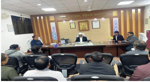
कमि को कभी भुला नहीं पायेंगी।