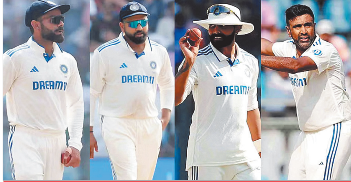
साल 2024 की सर्वश्रेष्ठ टेस्ट टीम में तीन भारतीय