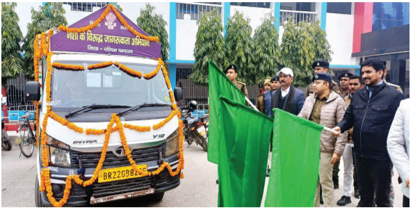
प्रातः किरण, संवाददाता

जिले के गाँवों, हाट-बाजारों में जाकर नशामुक्ति का संदेश देगा जागरूकता अभियान रथ