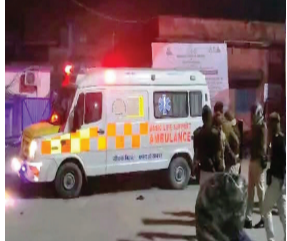
प्रातः किरण, संवाददाता

बगहा। बगहा में दो अलग अलग सड़क दुर्घटनाओं में बाइक सवार दो युवकों की दर्दनाक मौत हो गई है जबकि आधा दर्जन लोग बुरी तरह जख्मी हुए हैं। घायलों में एक रामनगर से तो दूसरा बगहा से जीएमसीएच बेतिया रेफर किये गए हैं। दरअसल घने कोहरे के बीच रफ्तार के कारण बगहा समेत रामनगर में भीषण सड़क हादसे हुए हैं,पहली घटना रामनगर थाना क्षेत्र के रामनगर - लौरीया मुख्य सड़क के बिच बैकुठवा मोड़ के पास की है जहाँ दो बाइक की आमने सामने की टक्कर में एक शख्स की मौत हो गई है जबकी दो अन्य गंभीर रूप से जख्मी बताये गए हैं। मृतक की पहचान लौरीया थाना क्षेत्र के