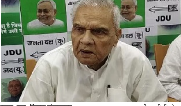
पटना, प्रातः किरण संवाददाता

बिहार सरकार के ऊर्जा मंत्री बिजेन्द्र प्रसाद यादव ने बताया कि वर्ष 2024 में राज्य के ऊर्जा प्रक्षेत्र में अनेक महत्वपूर्ण उपलब्धियों हासिल की गयी तथा राज्य के लोगों को बिजली की बेहतर सेवा एवं सुविधाएँ उपलब्ध कराने कि दिशा में कार्य किए गये। ऊर्जा मंत्री ने कहा कि मुख्यमंत्री ग्रामीण सोलर स्ट्रीट लाईट के अन्तर्गत सभी पंचायतों में वर्ष 2024 में 4.60 लाख सोलर स्ट्रीट लगाये जा चुके हैं तथा इस वर्ष निर्धारित कुल 11.00 लाख सोलर स्ट्रीट लाईट लगाने का लक्ष्य रखा गया है। श्री बिजेन्द्र प्रसाद यादव ने बताया कि पिछले वर्ष 2024 रिचार्जिंग डिस्ट्रिब्यूशन सेक्टर स्क्रीम योजना के तहत कुल 465 डेडिडकेटड कृषि फीटर बनाये गये तथा 35098 सर्किट किलोमीटर वितरण लाइन का रिचार्जिंग किया गया। वित्तीय वर्ष 2023-2024 में पहली बार राज्य की दोनों वितरण कम्पनियों वित्तीय रूप से आत्म निर्भर हो गयी हैं जिसके तहत वितरण कम्पनियों द्वारा पहली बार वित्तीय मुनाफे के साथ रिपोर्ट राजस्व संग्रहण किया गया है। वितरण कम्पनियों के आत्म निर्भर होने से उपभोक्ताओं