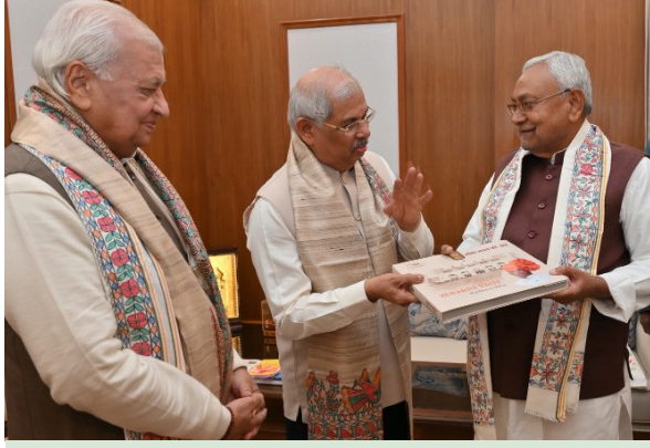
मुख्यमंत्री नीतीश कुमार ने राजभवन में निवर्तमान राज्यपाल राजेन्द्र विश्वनाथ आलेंकर और बिहार के नवनियुक्त राज्यपाल आरिफ मोहम्मद खान से शिष्टाचार मुलाकात की

पटना। बिहार के मुख्यमंत्री नीतीश कुमार ने राजभवन में निवर्तमान राज्यपाल राजेन्द्र विश्वनाथ आलेंकर और नवनियुक्त राज्यपाल आरिफ मोहम्मद खान से शिष्टाचार मुलाकात की। बता दें कि बिहार के नये राज्यपाल आरिफ मोहम्मद खान सोमवार को पटना पहुंचे। नीतीश कुमार सोमवार को दिल्ली में थे। इस कारण नये राज्यपाल से उनकी मुलाकात नहीं हो पायी थी। आरिफ मोहम्मद खान दो जनवरी को शपथ लेंगे। इससे पहले सोमवार को पटना पहुंचे आरिफ मोहम्मद खान ने हवाई अड्डे पर संवाददाताओं से कहा था कि वह राज्य की गौरवशाली परंपरा के अनुसार अपने कर्तव्यों का निर्वहन करने का प्रयास करेंगे। उन्होंने कहा- मैं बिहार के गौरवशाली इतिहास को