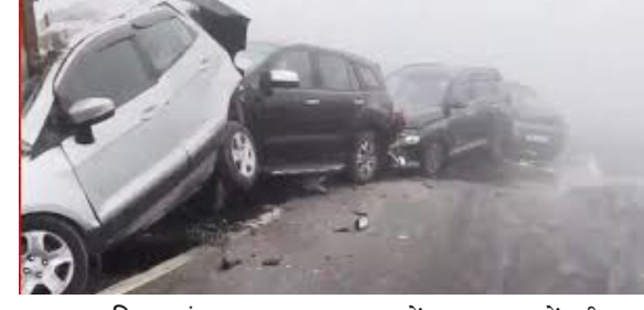
प्रातः किरण संवाददाता

अलीगढ़। आगरा-दिल्ली एक्सप्रेस वे पर घने कोहरे के कारण बुधवार की सुबह कई वाहन आपस में टकरा गये, जिसमें तीन लोग गंभीर रूप से घायल हो गए और कई बकरियां मर गईं। पुलिस ने यह जानकारी दी। पुलिस ने बताया कि यह दुर्घटना तब हुई जब खराब दृश्यता के कारण कई वाहन आपस में टकरा गए। इसमें करीब 200 से अधिक बकरियां ले जा रहा एक ट्रक भी शामिल था। इस टक्कर में तीन ट्रकों सहित छह वाहन बुरी तरह क्षतिग्रस्त हो गए। एक पुलिस अधिकारी ने बताया, घायलों को नजदीकी अस्पताल में भर्ती कराया गया है। इस मौसम के सबसे घने कोहरे के कारण क्षेत्र में यातायात बाधित हो गया और दोपहर तक दृश्यता की समस्या बनी रही।