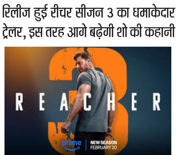
प्रातः किरण, / एजेसी

लॉस एंजेलिस, 1। प्राइम वीडियो ने रीचर सीजन 3 का ऑफिशियल ट्रेलर रिलीज कर दिया है। ये सीरीज आठ एपिसोड्स की होगी, जिसके एपिसोड वीकली अपलोड किए जाएंगे। शो के पहले तीन एपिसोड 20 फरवरी 2025 को आएंगे। इसके बाद हर गुरुवार को नए एपिसोड अपलोड होंगे। ये सिलसिला 27 मार्च 2025 तक जारी रहेगा। ये सीरीज 240 से ज्यादा देशों में प्रसारित होगी। आपको बता दें कि रीचर का दूसरा सीजन साल 2023 में प्राइम वीडियो पर सबसे ज्यादा देखा जाने वाला शो बना था। अब तीसरे सीजन के भी सफल होने की पूरी उम्मीदों के बीच शो के चौथे सीजन की अटकलों भी तेज हो गई हैं। खबर है चौथे सीजन की शूटिंग इसी साल शुरू होगी।