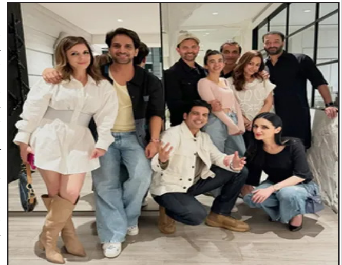
प्रातः किरण, / एजेसी