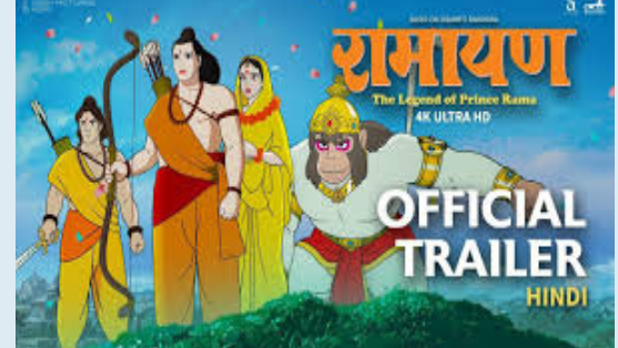
प्रातः किरण, / एजेसी

मुंबई, 1। बहुप्रतीक्षित फिल्म रामायण : द लीजेंड ऑफ प्रिंस रामा का ट्रेलर जारी कर दिया गया है, जिसमें फैंस और सिनेमा लवर्स में उत्साह की लहर है। यह फिल्म हिन्दुओं के धर्मग्रंथ वाल्मीकि की रामायण पर आधारित एक विजुअल मास्टरपीस है। ट्रेलर में शानदार विजुअल और युद्ध दृश्यों को दिखाया गया है, जो दर्शकों को अयोध्या, जहां प्रिंस राम का जन्म हुआ, मिथिला, जहां उन्होंने सीता से विवाह किया, पंचवटी का जंगल, जहां राम ने सीता और लक्ष्मण के साथ वनवास बिताया और लंका, जहां भगवान राम और रावण के बीच ऐतिहासिक युद्ध हुआ, इन सभी स्थानों को दिखाया है। ये सब कुछ खूबसूरती से जापानी एनीमे स्टाइल में पेश किया गया है। युगों साको की सोच और कोइची सासाकी और राम मोहन के निर्देशन में बनी ये फिल्म एक खास भारत-जापान का मिलाजुला प्रोजेक्ट है, जिसमें 450 से ज्यादा आर्टिस्ट्स ने करीब एक लाख हाथ से बने सेल्स का इस्तेमाल किया है। इसका रिजल्ट एक ऐसा विजुअल मास्टरपीस है, जो जापानी कला की खासियत और भारत की पुरानी कहानी कहने की टैडेंशन का शानदार कंबीनेशन है। ये फिल्म पहली बार 4ड में 24 जनवरी 2025 को भारत के सिनेमाघरों में रिलीज होने वाली है। इसे गोक पिक्चर्स इंडिया, एए फिल्मस और एक्सेल एंटरटेनमेंट के जरिए थिएट्रिकली डिस्ट्रीब्यूट किया जाएगा।