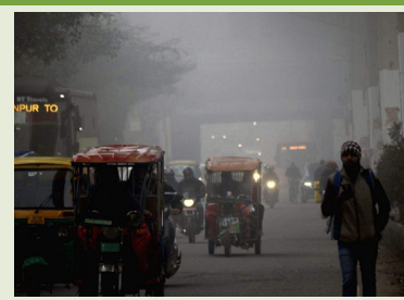
मौसम विज्ञान विभाग (आईएमडी) ने बताया कि आईजीआई हवाई अड्डे पर बहुत घना

कोहरा छाया रहा और दृश्यता शून्य मीटर दर्ज की गई। विभाग ने बताया कि सभी रनवे सीएटी-ट्यूब मानकों के तहत काम कर रहे हैं, जो कम दृश्यता की स्थिति में भी विमानों को उड़ान भरने की अनुमति देता है। आईजीआई हवाई अड्डा प्रतिदिन लगभग 1,300 उड़ानों का परिचालन करता है। मौसम विभाग के एक अधिकारी के अनुसार, सुबह आठ बजे पालम मौसम केंद्र ने पिछले दो घंटों में शून्य मीटर दृश्यता के साथ बहुत घने कोहरे की सूचना दी, जबकि प्राथमिक मौसम केंद्र सफदरजंग ने 50 मीटर