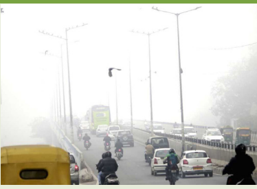
संबंधित विमानन सेवा से संपर्क करें। किसी भी असुविधा के लिए हमें गहरा खेद है। भारत

ने बताया कि खराब मौसम के कारण दिल्ली हवाई अड्डे पर 100 से अधिक उड़ानों के परिचालन में देरी हुई है, लेकिन फिलहाल किसी उड़ान का मार्ग परिवर्तित नहीं किया गया है। दिल्ली अंतरराष्ट्रीय हवाई अड्डा लिमिटेड (डीआईएएल) ने छह बजकर 35 मिनट पर सोशल मीडिया मंच एक्स पर एक पोस्ट में कहा, दिल्ली हवाई अड्डे पर लैंडिंग और टेकऑफ़ जारी रहने के बावजूद, जो उड़ानें सीएटी-ट्यूब के अनुरूप नहीं हैं, उन पर असर पड़ सकता है। यात्रियों से अनुरोध है कि वे उड़ान की अद्यतन जानकारी के लिए