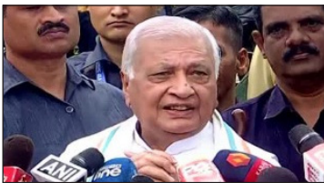
खान पहले केरल के राज्यपाल थे, और अब बिहार के राज्यपाल के रूप में उनकी नियुक्ति हुई

पटना। भारत सरकार ने नए राज्यपालों की नियुक्ति की है। बिहार राज्य के नए राज्यपाल के रूप में आरिफ मोहम्मद खान को नियुक्त किया गया है, जबकि केरल राज्य के राज्यपाल के रूप में राजेन्द्र विश्वनाथ आर्लेकर को चुना गया है। ये नियुक्तियां भारतीय राष्ट्रपति द्वारा की गई हैं। बिहार के राज्यपाल बदले : आरिफ मोहम्मद