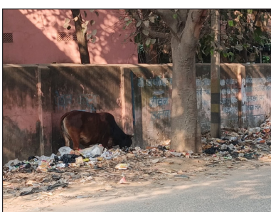
प्रातः किरण, संवाददाता

जमुई / सोनो : प्लस टु परियोजना उच्च विद्यालय सोनो के दिवाल से सटे भारी मात्रा में कचरे की अंबार लगी हुई है। जिससे निकलने वाली दुर्गंध से आमजनो सहित राहगीरों एवं विद्यालय मे शिक्षा ग्रहण करने वाले छात्राओं को भारी कठिनाइयों का सामना करना पड़ रहा है। साथ ही कचरे से निकलती इस दुर्गंध से विभिन्न प्रकार के विमारियाँ फैलने