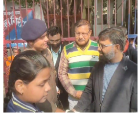
प्रातः किरण, संवाददाता

जमुई [ झाड़ा ] मंगलवार को झाड़ा पब्लिक स्कूल के छात्रों ने समाज में जागरूकता फैलाने के उद्देश्य से नशा मुक्ति अभियान के तहत एक जागरूकता रैली का आयोजन किया। इस रैली का मुख्य उद्देश्य नशे की लत से बचाव और इसके दुष्प्रभावों के प्रति लोगों को जागरूक करना था। इस अभियान में छात्रों के साथ-साथ शिक्षकों और स्कूल प्रबंधन ने भी सक्रिय भागीदारी निभाई। इस अभियान में झाड़ा के पुलिस प्रशासन एवं पत्रकार बंधुओं ने इस अभियान में हमारा भरपूर