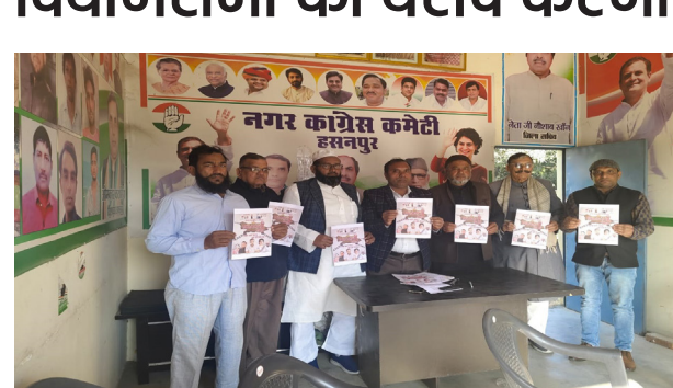
अपनी नाकामियों पर पर्दा डाल सके मगर कांग्रेस पार्टी संकल्पित है सरकार को हर नाकामी से पर्दा उठाने के लिए हम सड़क पर उतर कर संघर्ष कर रहे हैं और करते रहेंगे और उत्तर प्रदेश की योगी सरकार को जनता की आवास सुनने के लिए पजबूर करेंगे। आगे कहा कि सरकारी बिजली कंपनियों का निजीकरण करने जा रही है यह बात आईने के तरह साफ है कि निजीकरण की वजह बिजली की तरह बहुत बढ़ जाएगी और अंत में नुकसान आम जनता का होगा किसानों का होगा उपभोक्ताओं का होगा आगरा और ग्रेटर नोएडा में बिजली का निजीकरण बुरी तरह से असफल हो चुका है उत्तर प्रदेश में अन्नदाता किसानों के साथ भाजपा सरकार ने सौतेला व्यवहार किया है सरकार ने किसानों के हित में कोई काम तो किया नहीं उल्टे उनकी परेशानियों में इजाफा जरूर किया है आज गेहूं की बुवाई के समय डीपी खान पूरे प्रदेश में नहीं है किसने की गेहूं की बुवाई नहीं हो रही है बल्कि बीजेपी खाद की भाजपा नेताओं द्वारा कालाबाजारी की गई किस रीता रहा परेशान होता रहा पुलिस किस पर लाठी बरसती रही पर उसे खाद नहीं मिल किसान की फसल नहीं बोई गई किस को मजबूर किया गया बिचौलियों से खाद खरीदने के लिए किसान ने मजबूरी में महंगा खाद खरीद कर सरकार ने किसने की बिजली बिल माफ करने का वादा किया था माफनी तो छोड़िए बिजली की बिल बहुत बढ़े हुए आ रहे हैं प्रदेश में गन्ना किसानों का 7000 करोड रुपए से ज्यादा अभी सरकार और मिलन पर बकाया है वह पैसा किसानों को नहीं मिल रहा है सरकार अभी तक किसान गन्ना किसानों का रेट घोषित नहीं कर रही है गाने का रेट 500 किया जाए भाजपा की सरकारों ने युवाओं के लिए रोजगार के अवसर बहुत कम है बेरोजगारी कम पर है और सरकारी भर्तियां भ्रष्टाचार की भेंट चढ़ चुकी हैं आदि दिन पेपर लीक हो रहे हैं और अपनी नाकामी छुपाने के लिए सिर्फ धार्मिक सृष्टीकरण की नीति अपना रही है आम जनमानस की हर समस्या का केवल एक ही जवाब है योगी सरकार के पास हिंदू मुसलमान आदि दिन कोई ना कोई धार्मिक उदपाद फैलाने वाला एजेंडा सेट किया जाता है ताकि सरकार का आयोजन किया गया। जिसमे जिला अध्यक्ष ओमकार सिंह कटारिया ने कहा की 18 दिसंबर को भाजपा सरकार के कुशासन के खिलाफ उत्तर प्रदेश कांग्रेस कमेटी सुबह 11:00 बजे से विधानसभा का घेराव करेगी। आगे कहा की प्रदेश की जनता योगी सरकार के कुशासन से ट्रेट राय कर रही है सरकार हर मोर्चे पर विफल साबित हो रही है और अपनी नाकामी छुपाने के लिए सिर्फ धार्मिक सृष्टीकरण की नीति अपना रही है आम जनमानस की हर समस्या का केवल एक ही जवाब है योगी सरकार के पास हिंदू मुसलमान आदि दिन कोई ना कोई धार्मिक उदपाद फैलाने वाला एजेंडा सेट किया जाता है ताकि सरकार का आयोजन किया गया। जिसमे जिला अध्यक्ष ओमकार सिंह कटारिया ने कहा की 18 दिसंबर को भाजपा सरकार के कुशासन के खिलाफ उत्तर प्रदेश कांग्रेस कमेटी सुबह 11:00 बजे से विधानसभा का घेराव करेगी। आगे कहा की प्रदेश की जनता योगी सरकार के कुशासन से ट्रेट राय कर रही है सरकार हर मोर्चे पर विफल साबित हो रही है और अपनी नाकामी छुपाने के लिए सिर्फ धार्मिक सृष्टीकरण की नीति अपना रही है आम जनमानस की हर समस्या का केवल एक ही जवाब है योगी सरकार के पास हिंदू मुसलमान आदि दिन कोई ना कोई धार्मिक उदपाद फैलाने वाला एजेंडा सेट किया जाता है ताकि सरकार का आयोजन किया गया। जिसमे जिला अध्यक्ष ओमकार सिंह कटारिया ने कहा की 18 दिसंबर को भाजपा सरकार के कुशासन के खिलाफ उत्तर प्रदेश कांग्रेस कमेटी सुबह 11:00 बजे से विधानसभा का घेराव करेगी। आगे कहा की प्रदेश की जनता योगी सरकार के कुशासन से ट्रेट राय कर रही है सरकार हर मोर्चे पर विफल साबित हो रही है और अपनी नाकामी छुपाने के लिए सिर्फ धार्मिक सृष्टीकरण की नीति अपना रही है आम जनमानस की हर समस्या का केवल एक ही जवाब है योगी सरकार के पास हिंदू मुसलमान आदि दिन कोई ना कोई धार्मिक उदपाद फैलाने वाला एजेंडा सेट किया जाता है ताकि सरकार का आयोजन किया गया। जिसमे जिला अध्यक्ष ओमकार सिंह कटारिया ने कहा की 18 दिसंबर को भाजपा सरकार के कुशासन के खिलाफ उत्तर प्रदेश कांग्रेस कमेटी सुबह 11:00 बजे से विधानसभा का घेराव करेगी। आगे कहा की प्रदेश की जनता योगी सरकार के कुशासन से ट्रेट राय कर रही है सरकार हर मोर्चे पर विफल साबित हो रही है और अपनी नाकामी छुपाने के लिए सिर्फ धार्मिक सृष्टीकरण की नीति अपना रही है आम जनमानस की हर समस्या का केवल एक ही जवाब है योगी सरकार के पास हिंदू मुसलमान आदि दिन कोई ना कोई धार्मिक उदपाद फैलाने वाला एजेंडा सेट किया जाता है ताकि सरकार का आयोजन किया गया। जिसमे जिला अध्यक्ष ओमकार सिंह कटारिया ने कहा की 18 दिसंबर को भाजपा सरकार के कुशासन के खिलाफ उत्तर प्रदेश कांग्रेस कमेटी सुबह 11:00 बजे से विधानसभा का घेराव करेगी। आगे कहा की प्रदेश की जनता योगी सरकार के कुशासन से ट्रेट राय कर रही है सरकार हर मोर्चे पर विफल साबित हो रही है और अपनी नाकामी छुपाने के लिए सिर्फ धार्मिक सृष्टीकरण की नीति अपना रही है आम जनमानस की हर समस्या का केवल एक ही जवाब है योगी सरकार के पास हिंदू मुसलमान आदि दिन कोई ना कोई धार्मिक उदपाद फैलाने वाला एजेंडा सेट किया जाता है ताकि सरकार का आयोजन किया गया। जिसमे जिला अध्यक्ष ओमकार सिंह कटारिया ने कहा की 18 दिसंबर को भाजपा सरकार के कुशासन के खिलाफ उत्तर प्रदेश कांग्रेस कमेटी सुबह 11:00 बजे से विधानसभा का घेराव करेगी। आगे कहा की प्रदेश की जनता योगी सरकार के कुशासन से ट्रेट राय कर रही है सरकार हर मोर्चे पर विफल साबित हो रही है और अपनी नाकामी छुपाने के लिए सिर्फ धार्मिक सृष्टीकरण की नीति अपना रही है आम जनमानस की हर समस्या का केवल एक ही जवाब है योगी सरकार के पास हिंदू मुसलमान आदि दिन कोई ना कोई धार्मिक उदपाद फैलाने वाला एजेंडा सेट किया जाता है ताकि सरकार का आयोजन किया गया। जिसमे जिला अध्यक्ष ओमकार सिंह कटारिया ने कहा की 18 दिसंबर को भाजपा सरकार के कुशासन के खिलाफ उत्तर प्रदेश कांग्रेस कमेटी सुबह 11:00 बजे से विधानसभा का घेराव करेगी। आगे कहा की प्रदेश की जनता योगी सरकार के कुशासन से ट्रेट राय कर रही है सरकार हर मोर्चे पर विफल साबित हो रही है और अपनी नाकामी छुपाने के लिए सिर्फ धार्मिक सृष्टीकरण की नीति अपना रही है आम जनमानस की हर समस्या का केवल एक ही जवाब है योगी सरकार के पास हिंदू मुसलमान आदि दिन कोई ना कोई धार्मिक उदपाद फैलाने वाला एजेंडा सेट किया जाता है ताकि सरकार का आयोजन किया गया। जिसमे जिला अध्यक्ष ओमकार सिंह कटारिया ने कहा की 18 दिसंबर को भाजपा सरकार के कुशासन के खिलाफ उत्तर प्रदेश कांग्रेस कमेटी सुबह 11:00 बजे से विधानसभा का घेराव करेगी। आगे कहा की प्रदेश की जनता योगी सरकार के कुशासन से ट्रेट राय कर रही है सरकार हर मोर्चे पर विफल साबित हो रही है और अपनी नाकामी छुपाने के लिए सिर्फ धार्मिक सृष्टीकरण की नीति अपना रही है आम जनमानस की हर समस्या का केवल एक ही जवाब है योगी सरकार के पास हिंदू मुसलमान आदि दिन कोई ना कोई धार्मिक उदपाद फैलाने वाला एजेंडा सेट किया जाता है ताकि सरकार का आयोजन किया गया। जिसमे जिला अध्यक्ष ओमकार सिंह कटारिया ने कहा की 18 दिसंबर को भाजपा सरकार के कुशासन के खिलाफ उत्तर प्रदेश कांग्रेस कमेटी सुबह 11:00 बजे से विधानसभा का घेराव करेगी। आगे कहा की प्रदेश की जनता योगी सरकार के कुशासन से ट्रेट राय कर रही है सरकार हर मोर्चे पर विफल साबित हो रही है और अपनी नाकामी छुपाने के लिए सिर्फ धार्मिक सृष्टीकरण की नीति अपना रही है आम जनमानस की हर समस्या का केवल एक ही जवाब है योगी सरकार के पास हिंदू मुसलमान आदि दिन कोई ना कोई धार्मिक उदपाद फैलाने वाला एजेंडा सेट किया जाता है ताकि सरकार का आयोजन किया गया। जिसमे जिला अध्यक्ष ओमकार सिंह कटारिया ने कहा की 18 दिसंबर को भाजपा सरकार के कुशासन के खिलाफ उत्तर प्रदेश कांग्रेस कमेटी सुबह 11:00 बजे से विधानसभा का घेराव करेगी। आगे कहा की प्रदेश की जनता योगी सरकार के कुशासन से ट्रेट राय कर रही है सरकार हर मोर्चे पर विफल साबित हो रही है और अपनी नाकामी छुपाने के लिए सिर्फ धार्मिक सृष्टीकरण की नीति अपना रही है आम जनमानस की हर समस्या का केवल एक ही जवाब है योगी सरकार के पास हिंदू मुसलमान आदि दिन कोई ना कोई धार्मिक उदपाद फैलाने वाला एजेंडा सेट किया जाता है ताकि सरकार का आयोजन किया गया। जिसमे जिला अध्यक्ष ओमकार सिंह कटारिया ने कहा की 18 दिसंबर को भाजपा सरकार के कुशासन के खिलाफ उत्तर प्रदेश कांग्रेस कमेटी सुबह 11:00 बजे से विधानसभा का घेराव करेगी। आगे कहा की प्रदेश की जनता योगी सरकार के कुशासन से ट्रेट राय कर रही है सरकार हर मोर्चे पर विफल साबित हो रही है और अपनी नाकामी छुपाने के लिए सिर्फ धार्मिक सृष्टीकरण की नीति अपना रही है आम जनमानस की हर समस्या का केवल एक ही जवाब है योगी सरकार के पास हिंदू मुसलमान आदि दिन कोई ना कोई धार्मिक उदपाद फैलाने वाला एजेंडा सेट किया जाता है ताकि सरकार का आयोजन किया गया। जिसमे जिला अध्यक्ष ओमकार