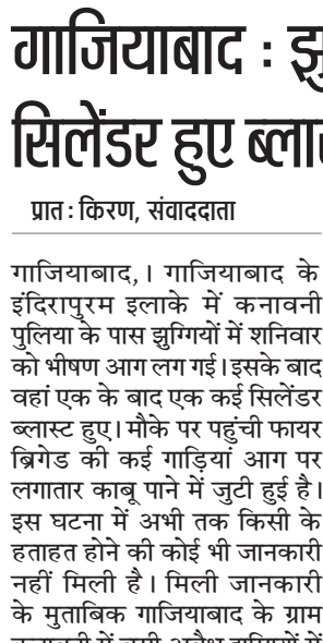
सामान किसी तरह से झुगियों से बाहर निकल कर भागते दिखाई दिए। आग लगने के दौरान झुगियों में रखे सिलेंडर में हो रहे ब्लास्ट से आसपास के इलाकों में आवाज पहुंचने से लोग में दहशत का माहौल बन गया है। फायर विभाग के अधिकारियों ने आसपास के अन्य फायर स्टेशनों से भी दमकल की गाड़ियों को मौके पर बुलाया है। सूचना मिलने ही मौके पर पुलिस के आला अधिकारी पहुंच गए हैं।

गाजियाबाद, 1। गाजियाबाद के इंदिरापुरम इलाके में कनावनी पुलिया के पास झुगियों में शनिवार को भीषण आग लग गई। इसके बाद वहां एक के बाद एक कई सिलेंडर ब्लास्ट हुए। मौके पर पहुंची फायर ब्रिगेड की कई गाड़ियां आग पर लगातार काबू पाने में जुटी हुई हैं। इस घटना में अभी तक किसी के हताहत होने की कोई भी जानकारी नहीं मिली है। मिली जानकारी के मुताबिक गाजियाबाद के ग्राम कनावनी में बसी अवैध झुगियों में अचानक आग लग गई। बताया जा रहा है पहले यह आग एक झुग्गी में लगी और उसके बाद धीरे-धीरे यह सभी झुगियों में तेजी से फैलने लगी। आसपास में रह रहे झुगियों के लोगों ने भाग कर अपनी जान बचाई। फायर विभाग के अधिकारी और स्थानीय पुलिस बल मौके पर मौजूद हैं और आसपास के लोगों से उस जगह को खाली करा लिया गया है। आग काफी भीषण थी। झुगियों में रह रहे लोग अपना