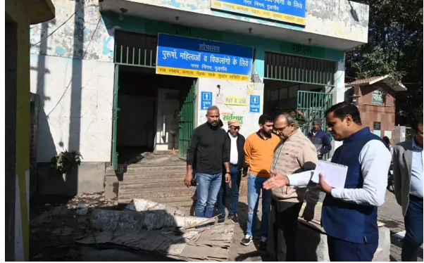
कंपोस्ट बनाने की व्यवस्था शुरू करवाने की बात कही। उन्होंने कहा कि इसके लिए किसी एनजीओ या एक्सपर्ट की सेवाएं लेने की प्रक्रिया शुरू कराए। इसके साथ ही एमआरएफ को भी शुरू करवाने की बात निगमायुक्त द्वारा कही गई। इसके बाद कोर्ट रोड का निरीक्षण करने के दौरान निगमायुक्त ने सडक के किनारों पर पड़ी मिट्टी व मलबे को उठाने, आसपास पड़ी पॉलीथीन व कूड़े को साफ करने के निर्देश संबंधित अधिकारियों से कहा कि

गुरुग्राम, 1। नगर निगम गुरुग्राम के आयुक्त अशोक कुमार गर्ग शनिवार को अचानक शहर के विभिन्न क्षेत्रों का दौरा करने के लिए निकले। उन्होंने एक दर्जन से अधिक स्थानों का निरीक्षण करते हुए सफाई व्यवस्था, सार्वजनिक शौचालय, अतिक्रमण, सीवरेज, सीएंडडी वेस्ट आदि की स्थिति को देखा तथा अधिकारियों को आवश्यक दिशा-निर्देश दिए। उन्होंने बेरीवाला बाग, राजीव चौक, कोर्ट रोड, सोहना चौक, गुरुद्वारा रोड, सखी मंडी, ओल्ड जेल कॉम्प्लेक्स, खांडसा रोड, सेक्टर-37, बसई रोड सहित अन्य स्थानों का दौरा किया। सबसे पहले वे बेरीवाला बाग स्थित मैटैरियल रिकवरी फैसिलिटी पहुंचे। वहां का निरीक्षण के दौरान उन्होंने एमआरएफ से नियमित कचरा उठान सुनिश्चित करने के निर्देश दिए। इसके साथ ही उन्होंने यहां पर गीले कचरे से