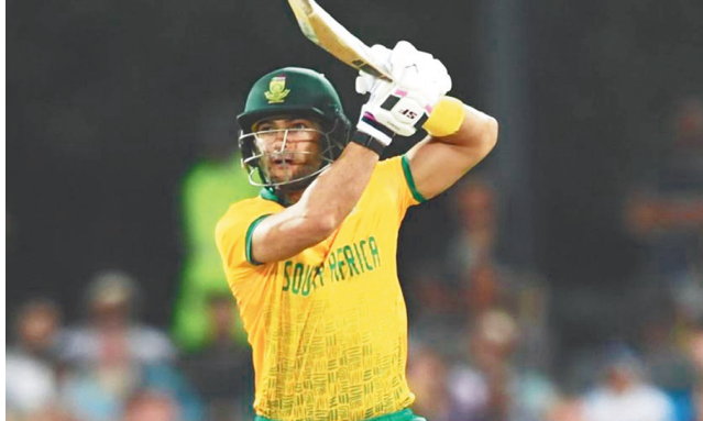
ओवर में 5 विकेट पर 206 रन बनाए। और 5 छक्के की मदद से नाबाद 98 रन बनाए। इसके अलावा बाबर आजम

नई दिल्ली, एजेंसी। रीजा हेडिंग्स ने अंतरराष्ट्रीय क्रिकेट में अपने 10वें साल में पहला टी20 शतक जड़ा। इसके चलते साउथ अफ्रीका ने अगस्त 2022 के बाद पहली बार द्विपक्षीय टी20 सीरीज अपने नाम की। आयरलैंड के खिलाफ जीत के बाद टीम 8 सीरीज खेली। 77 टीम ने सेंचुरियन के सुपरस्पॉट पार्क में तीसरा सबसे बड़ा स्कोर चेंज किया। मार्च 2023 में व्हाइट-बॉल कोचिंग की जिम्मेदारी संभालने के बाद रॉब वाल्टर की पहली टी20 सीरीज जीत भी है। इससे पहले सैम अयूब की तूफानी बल्लेबाजी के दम पर पाकिस्तान ने 20