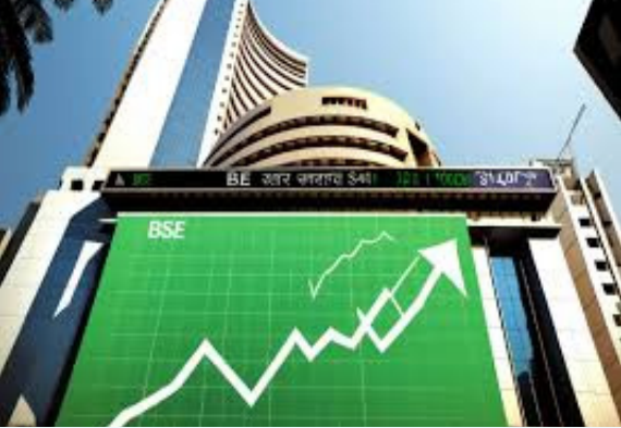
ट्रेडिंग हो रही थी। इनमें से 1,064 शेयर मुनाफा कमा कर रहे निशान में कारोबार कर रहे थे, जबकि 1,237 शेयर नुकसान उठा कर लाल निशान

दस बजे तक का कारोबार होने के बाद स्टॉक मार्केट के दिग्गज शेयरों में से बीपीसीएल, एसबीआई लाइफ इश्योरेंस, स्टेट बैंक ऑफ इंडिया, ओएनजीसी और महिंद्रा एंड महिंद्रा के शेयर 2.26 प्रतिशत से लेकर 0.66 प्रतिशत की मजबूती के साथ कारोबार कर रहे थे। दूसरी ओर, एशियन पेंट्स, टेक महिंद्रा, ट्रेंट लिमिटेड, टाटा कंज्यूमर प्रोडक्ट्स और सिप्ला के शेयर 0.50 प्रतिशत से लेकर 0.34 प्रतिशत की गिरावट के साथ कारोबार करते हुए नजर आ रहे थे। अभी तक के कारोबार में स्टॉक मार्केट में 2,301 शेयरों में एक्टिव