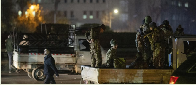
बाद सशस्त्र निवासियों ने एचटीएस से जुड़े एक वाहन में आग लगा दी। रिपोर्ट में कहा गया है कि सैन्य गठबंधन की यूनिट 82 और के 9 दस्तों का एक बड़ा काफिला

अधिकारी सुरक्षा बनाए रखने और नागरिकों की रक्षा करने के लिए अपनी इयूटी निभा रहे थे। इससे पहले, यह रिपोर्ट किया गया था कि टार्टस प्रांत में हयात तहरीर अल-थायाम (एचटीएस) के नेतृत्व वाले सैन्य गठबंधन और स्थानीय सशस्त्र निवासियों और सुरक्षा कर्मियों के बीच हिंसक झड़पें हुईं। सीरियन ऑब्जर्वेटरी फॉर ह्यूमन राइट्स की रिपोर्ट के मुताबिक, लड़ाई खारबेट अल-मजजा गांव में तब शुरू हुई, जब स्थानीय लोगों ने सुरक्षा बलों द्वारा उनके घरों की जांच का विरोध किया, जिसके