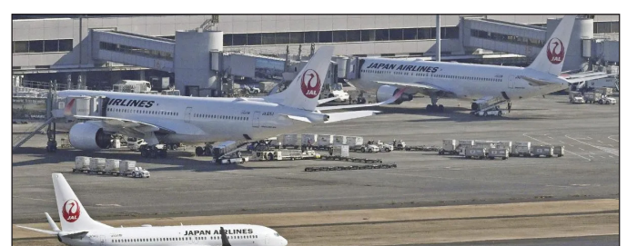
हमला नेटवर्क सिस्टम को डेटा के बड़े पैमाने पर प्रसारण से बाधित करने के उद्देश्य से किया गया था। इस तरह के हमले सिस्टम या नेटवर्क को तब तक बेहद व्यस्त कर देते हैं जब तक कि लक्षित प्रतिक्रिया नहीं मिल जाती या सिस्टम क्रैश नहीं हो जाता। जेएएल ने

तोकोयो। जापान एयरलाइंस (जेएएल) ने कहा कि बृहस्पतिवार को उस पर साइबर हमला होने के कारण उसकी 20 से ज्यादा घरेलू उड़ानों में देरी हुई, लेकिन उसने कुछ घंटों बाद अपने सिस्टम को बहाल कर लिया तथा उड़ान सुरक्षा पर भी कोई असर नहीं पड़ा। जेएएल ने कहा कि समस्या बृहस्पतिवार की सुबह तब शुरू हुई जब कंपनी के आंतरिक और बाहरी सिस्टम को जोड़ने वाले नेटवर्क में खराबी आने लगी। एयरलाइन ने कहा कि उसने इसका कारण यह पता लगाया कि यह