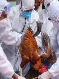
65 मामलों के आधे से भी अधिक हैं, हालांकि वास्तविक संख्या इससे अधिक होने की संभावना है, क्योंकि हाल ही में स्थानीय स्तर पर पुष्टि के मामले संश्लेषण आंकड़ों में अभी तक जुड़े नहीं हैं। कैलिफोर्निया के लॉस एंजिल्स काउंटी और स्टैनिसलाउ काउंटी में सोमवार को दो नए मामलों की पुष्टि हुई थी। दोनों काउंटी के स्वास्थ्य विभागों के अनुसार, दोनों व्यक्ति अपने कार्यस्थल पर बर्ड फ्लू से संक्रमित पशुओं के संपर्क में आए थे। दोनों व्यक्तियों में इस वायरस के हल्के लक्षण थे और उनका एंटीवायरल दवाओं से इलाज किया गया था। बता दें कि इस वायरस पर नियंत्रण पाने के लिए स्वास्थ्य अधिकारी पूरे कैलिफोर्निया राज्य में अपशिष्ट जल की निगरानी कर रहे हैं।

सैं फ्रांसिस्को। अमेरिका के कैलिफोर्निया में एड्सिन इन्फ्लुएंजा ए (एच5एन1) वायरस के मामले लगातार बढ़ते जा रहे हैं। कैलिफोर्निया के अधिकारियों के अनुसार, बर्ड फ्लू ने अप्रैल से अब तक 984 डेयरियों में से 659 को प्रभावित किया है। इसमें से एक-चौथाई मामले पिछले महीने में ही सामने आए। समाचार एजेंसी सिन्धुआ के अनुसार, राज्य के डेयरी उद्योग में तेजी से फैल रहे इस वायरस के कारण गवर्नर गैविन न्यूसम ने राज्य में पिछले सप्ताह आपातकाल की घोषणा की थी।