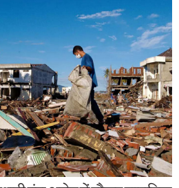
राजधानी बंदा असेह में मौजूद सामूहिक कब्रों में से एक है। सुनामी ने यहां सबसे ज्यादा तबाही मचाई थी। इंडोनेशिया

बंदा असेह (इंडोनेशिया)। हिंद महासागर में 20 साल पहले आई सुनामी में मारे गए व्यक्तियों की याद में इंडोनेशिया के असेह प्रांत में बृहस्पतिवार को लोगों ने सामूहिक कब्रों पर पहुंचकर श्रद्धांजलि दी और शोक प्रकट किया। उली लहुए गांव में सामूहिक कब्र पर काफी संख्या में लोग पहुंचे, जहां 14,000 से अधिक अज्ञात लोगों के शवों को दफनाया गया था। यह इंडोनेशिया के असेह प्रांत की