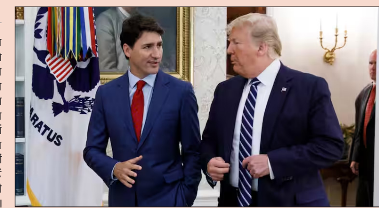
पर अपनी गहन बातचीत जारी रख सकें, इसके परिणाम सभी के लिए वास्तव में शानदार होंगे! ट्रंप की इस टिप्पणी ने अंतरराष्ट्रीय राजनीति में नई तरंग की डिबेट को जन्म दिया है। इसमें कई लोगों ने सवाल उठाया कि क्या यह जानबूझकर किया गया अपमान था। नवनिर्वाचित राष्ट्रपति ने कट्टरपंथी वामपंथी पागलों की भी आलोचना की। अपनी विवादास्पद टिप्पणियों में ट्रंप ने पनामा नहर पर अमेरिकी नियंत्रण को बारी में परोक्ष धमकी देते हुए कहा, सभी को मेरी फ्रिसमस की शुभकामनाएं, जिसमें चीन के

वाशिंगटन। अमेरिका के नवनिर्वाचित राष्ट्रपति डोनाल्ड ट्रंप ने फ्रिसमस की शुभकामनाएं देते हुए कनाडाई पीएम पर फिटर तंज कसा है। अपने सोशल मीडिया प्लेटफॉर्म ट्विटर पर उन्होंने कनाडा के प्रधानमंत्री जस्टिन टूडो को कनाडा का गवर्नर कहा है। ट्रंप ने अपनी पोस्ट में कहा कि यदि कनाडा संयुक्त राज्य अमेरिका का 51वां राज्य बन जाता है, तो उनके टैक्सों में 60 प्रतिशत से अधिक की कटौती हो जाएगी, उनके व्यवसायों का आकार तुरंत दोगुना हो जाएगा, और उन्हें अमेरिका की सैन्य सुरक्षा भी प्राप्त हो जाएगी जो दुनिया में किसी भी अन्य देश को नहीं मिलेगी। उन्होंने आगे सुझाव दिया कि नेशनल हॉकी लीग (एनएचएल) के दिग्गज वेन ग्रेट्जकी को देश का नेतृत्व करना चाहिए।