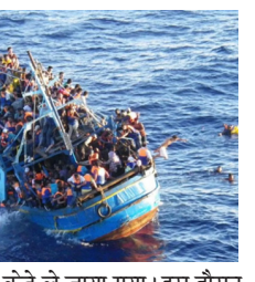
उन्हें क्रेते ले जाया गया। इस दौरान जलक्षेत्र से पांच शव बरामद किए गए। सुरक्षित बचाव गए लोगों ने बताया कि उनका नौका में बड़ी संख्या में लोग सवार थे। तट रक्षक बल ने बताया कि कुल नौ जहाज शनिवार को भी बचाव कार्य में लगे हुए हैं साथ ही दो हेलीकॉप्टर की भी बचाव कार्य में मदद ली जा रही है। गावडोस के तट पर अन्य दो अभियानों में क्रमशः 47 और 89 लोगों को बचाया गया। ये अभियान पूरे हो चुके हैं। वहीं पेलोपोनिज से 28 शरणार्थियों को बचाया गया।

प्रातः किरण/ एजेंसी एथेंस। ग्रीस में क्रेते द्वीप के दक्षिण में शरणार्थियों को ले जा रही नौका डूबने से पांच लोगों की मौत हो गई वहीं कई लोग लापता हैं। तट रक्षक बल ने बताया कि चार खोज एवं बचाव अभियानों में 200 से अधिक लोगों को बचाया गया। तट रक्षक बल के अनुसार चार अभियान शुक्रवार दे रात शुरू हुए जिसमें से एक अब भी जारी है। क्रेते के दक्षिण में गावडोस द्वीप के पास नौका डूबने की अलग-अलग घटनाओं के बारे में सूचना मिलने के बाद तीन अभियान शुरू किए गए जिनमें से एक अब भी जारी है और चौथा अभियान दक्षिणी पेलोपोनिज क्षेत्र में शुरू किया गया। तट रक्षक बल ने बताया कि तलाश अभियान में 39 लोगों को बचा लिया गया है और