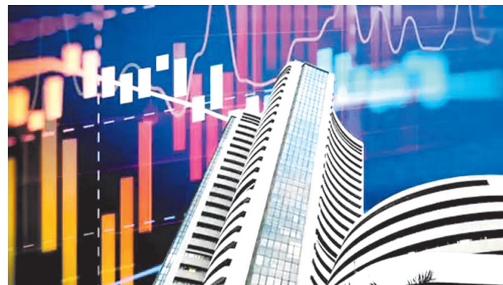
इसका रिटर्न 1200 फीसदी से ज्यादा रहा है।

नई दिल्ली, एजेंसी। शेयर मार्केट में फिर से तेजी नजर आने लगी है। शुक्रवार को सेंसेक्स में 800 अंकों से ज्यादा तक की तेजी आई थी। इस तेजी से साथ यह फिर से 82 हजार के पार पहुंच गया है। कई कंपनियों के शेयर ने पिछले कुछ वर्षों में निवेशकों को जबरदस्त रिटर्न दिया है। वहीं इनमें काफी ऐसे भी हैं जिन्होंने एक साल में ही निवेश को दोगुना कर दिया है। इससे ज्यादा समय के लिए इनका रिटर्न और ज्यादा रहा है। अगर आप अपने निवेश को एक साल में दोगुना करना चाहते हैं तो अच्छी कंपनियों के शेयर में निवेश कर सकते हैं।