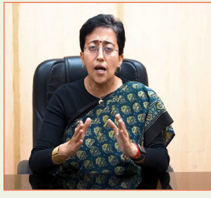
लोग अपने घर से बाहर निकलने में सुरक्षित महसूस नहीं करते जबकि शहर में अपराधी

दिल्लीवालों को सुरक्षा देना है लेकिन उन्होंने कहा कि, शहर में बिगड़ती कानून व्यवस्था के कारण दिल्लीवाले परेशान है, लोग अपने घर से बाहर निकलने में सुरक्षित महसूस नहीं करते जबकि शहर में अपराधी