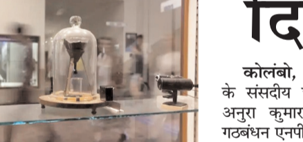
(जो कोलतार जैसा दिखता है) में समय के साथ कितना बदलाव आता है।