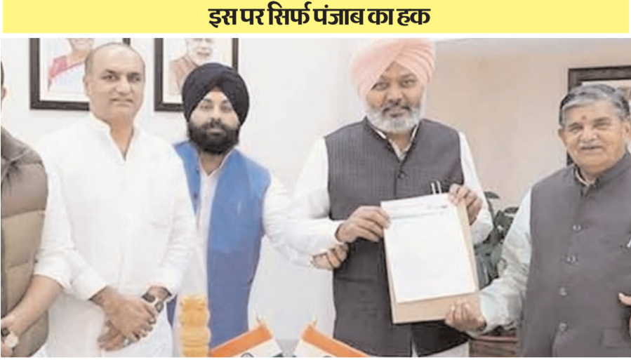
इस पर सिर्फ पंजाब का हक