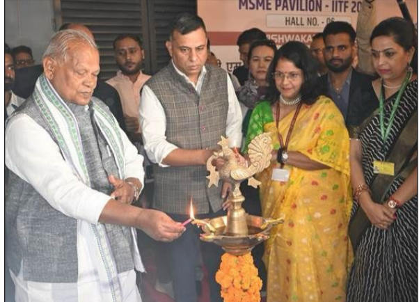
शुरू से अंत तक सहायता प्रदान करने के लिए मंत्रालय की प्रमुख योजना हूपीएम विश्वकर्मा योजना का भी जानकारी उपलब्ध कराता है। यह योजना भारत के प्रधानमंत्री श्री नरेन्द्र मोदी ने 17 सितंबर, 2023 को शुरू