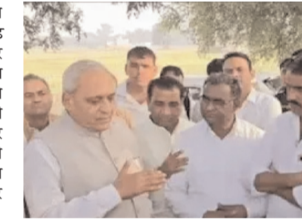
इस तरह आई अधिकारियों की लापरवाही सामने