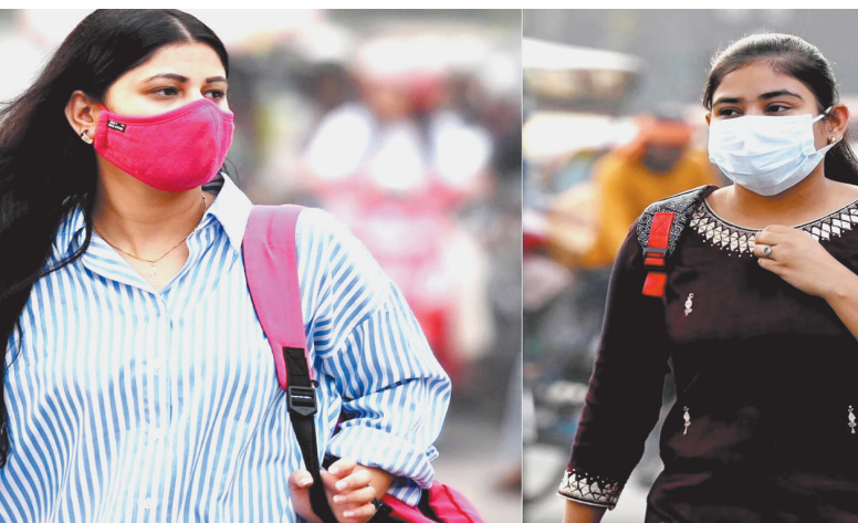
विशेषज्ञों ने कारण गिनाए और समाधान भी बताया

देहरादून, एजेंसी। देहरादून की आबोहवा अब ज्यादा प्रदूषित होने लगी है। चिंताजनक बात यह है कि यहाँ के प्रदूषण का स्तर गाजियाबाद, मेरठ और मुजफ्फरनगर जैसे शहरों से भी अधिक होने लगा है। सोमवार को केंद्रीय प्रदूषण नियंत्रण बोर्ड की रिपोर्ट के मुताबिक, देहरादून भारत के उन 258 शहरों की सूची में नौवें स्थान पर है, जहाँ वायु प्रदूषण सबसे ज्यादा है। बारिश का अभाव, हवाओं का कमजोर रुख और दूसरे प्रदेशों से आ रहा पराली के धुएँ को इसकी वजह बताया गया है। सीपीसीबी की रिपोर्ट के मुताबिक, देहरादून में सोमवार को एक्वआई 287 और ऋषिकेश में एक्वआई 208 दर्ज किया गया, जो खराब श्रेणी में आता है और लोगों के स्वास्थ्य के लिए हानिकारक है। जबकि, गाजियाबाद में एक्वआई 252, जयपुर में 237, मेरठ में 211 और मुजफ्फरनगर में 240 दर्ज किया गया। ग्रेटर नोएडा जैसी जगह भी एक्वआई 285 रहा, जो देहरादून के मुकाबले कम है।