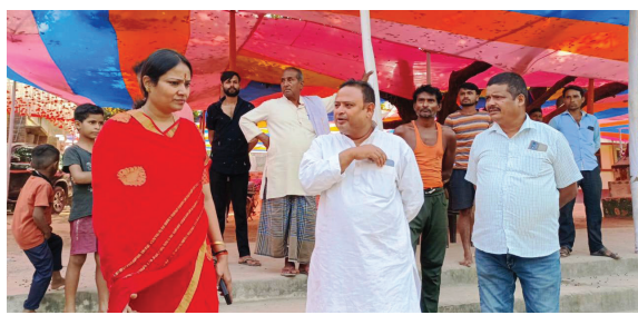
प्रातः किरण, संवाददाता

बेतिया (घनश्याम)। महापौर गरिमा देवी सिकारिया ने उपनगर आयुक्त गोपाल कुमार के साथ सघन शहरी क्षेत्र सहित नगर निगम के दर्जनों मुख्य छठ घाटों का निरीक्षण करने के बाद साफ सफाई और सुरक्षा प्रबंध के सुधार का निर्देश दिया। उन्होंने बताया कि नगर निगम क्षेत्र में विविध कुल 62 से अधिक छठ घाटों पर साफ सफाई और सुरक्षा प्रबंध को फाइनल टच देने का कार्य बुधवार को पूरा कर लिया गया। बावजूद इसके विभिन्न वार्डों के छठ घाटों पर प्रतिनियुक्त नगर निगम कर्मियों को 8 नवंबर को प्रातः कालीन अर्घ्य सम्यन् होने तक अपने अपने आवंटित छठ घाटों पर मुस्तैद रहने के निर्देश दिए गए हैं। इस दौरान मिले इलेक्ट्रॉनिक और फिट मीडिया पत्रकार- छायाकारों से महापौर श्रीमती सिकारिया ने कहा कि हमारा छठ सिर्फ धार्मिक आस्था का प्रतीक नहीं