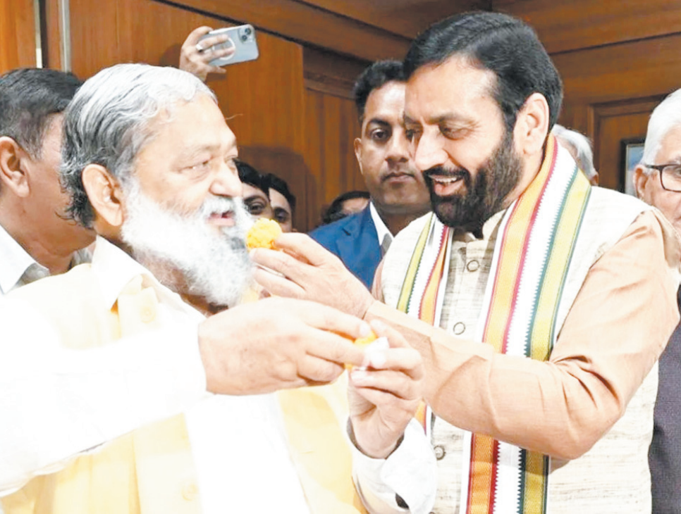
अंबाला, एजेंसी। अकसर अपने बयानों से चर्चा में रहने वाले हरियाणा के वरिष्ठ मंत्री अनिल विज ने सनसनीखेज आरोप लगाया है। उनका कहना है कि इस

मर जाए और चुनाव को प्रभावित किया जा सके। अपनी ही सरकार पर अनिल विज के इस तरह के आरोपों ने सियासत में नई सनसनी पैदा कर दी है। अनिल विज खुद को सीएम पद का दावेदार बताते रहे हैं, लेकिन एक बार फिर से नाथ सिंह सैनी को ही मौका मिला है।