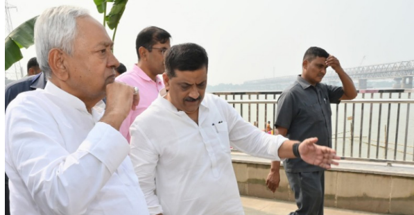
पटना, प्रातः किरण संवाददाता

मुख्यमंत्री ने बेगूसराय जिले के नवनिर्मित सिमरिया घाट का किया निरीक्षण