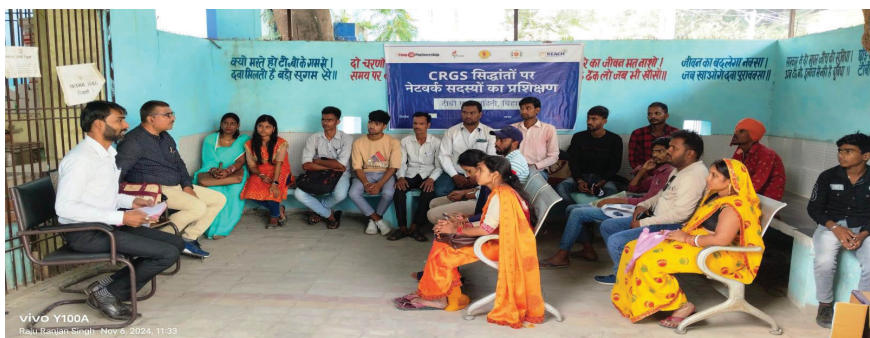
प्रातः किरण, संवाददाता

छपरा। टीबी मुक्त भारत के लक्ष्य को हासिल करने के लिए स्वास्थ्य विभाग संकल्पित है। इसको लेकर विभिन्न स्तर पर प्रयास किया जा रहा है। अब जिले में पंचायत स्तर पर टीबी के प्रति जागरूकता फैलाने तथा टीबी मुक्त पंचायत घोषित करने के लिए पंचायतों को गोद लिया जायेगा। टीबी मुक्त वाहिनी संस्था के द्वारा बिहार में 100 पंचायतों को गोद लिया जायेगा। गोद लिये गये पंचायतों में टीबी चैंपियन के माध्यम से जागरूकता अभियान चलाया जायेगा तथा टीबी के मरीजों को अधिकार दिलाया जायेगा। इसको लेकर टीबी मुक्त वाहिनी द्वारा जिला टीबी कार्यालय में टीबी चैंपियंस का एक दिवसीय प्रशिक्षण शिविर