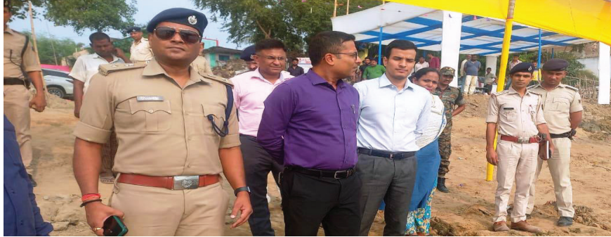
प्रातः किरण, संवाददाता

डोरीगंज । सारण जिले में लोक आस्था का महापर्व छठ पूजा को लेकर तैयारियां जोरों पर है। डीएम से लेकर पुलिस अधिकारी तक हर कोई छठ पूजा की तैयारी में जुट गए हैं। इस बीच सारण जिलाधिकारी अमन समीर ने डोरीगंज के तिवारीघाट, बंगाली बाबा घाट, जहाज घाट, डोरीगंज घाट का निरीक्षण किया, जहां उनके साथ पुलिस अधीक्षक डॉ कुमार आशीष भी मौजूद थे।