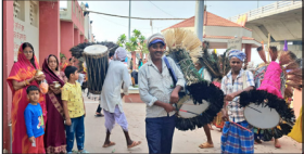
पटना सिटी (प्राकि) महापर्व छठ के अवसर पर छठ पड़ती गंगा नदी के विभिन्न घाट को गए। इस दौरान डंकावाला भी मोर पंख लगाए गए कृतियों के साथ पहुंचे थे वहां मिले अन्य डंकावालों ने एक जूता दिखाई और सभी डंका बजाते हुए नाचते घूमते हुए भारतीयों की रिझाने का काम किया हालांकि अधिकांश डंकावाला लखीसराय मोकामा, जमुई, खुसरूपुर, बड़हिया मननपुर से आए हैं। इसके बाद नहर में दो जगहों पर अस्थाई बांध बांधकर पंपसेट द्वारा बदलपुरा स्थित जलमीनार से पानी चार फीट तक नहर में भरा जाएगा। इसके साथ ही घाट पर रोशनी एवं पेयजल की समुचित व्यवस्था रहेगी। वहीं उन्होंने बताया की चौरांगी रूम एवं निरीक्षण केन्द्र बनाने का कार्य