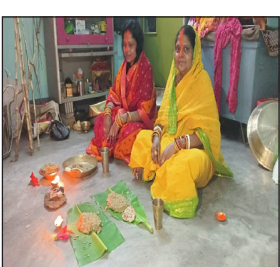
समिति व स्वयंसेवी संगठन इलाके की सफाई रोशनी व गंगा घाट जाने वाले मार्ग को दुरुस्त करने में जुट गये। नगर के बीबीगंज से लेकर नयाटोला तक विभिन्न पूजा समिति ने विद्युत की आकर्षक सजावट से इलाका को जगमग कर दिया है। पूरा नगर विद्युत की रोशनी से चकाचौंध हो उठा। व्रतियों ने बताया कि गंगा के जल से खरना का प्रसाद बनता है इसी से लोग गंगा जल ले जाते

दानापुर। नगर के अंतर्गत सूर्योपासना का महापर्व के चार दिवसीय अनुष्ठान के दूसरे दिन पूरे श्रद्धा व पवित्रता के साथ व्रतियों ने खरना किया। खरना के साथ ही व्रतियों ने 36 घंटे का निर्जला उपवास प्रारंभ किया। गुरुवार को व्रती अस्तचलगामी सूर्य को अर्घ्य देगे व शुक्रवार को उदयगामी सूर्य को अर्घ्य देकर व्रत का पारण करेंगे। खरना को लेकर नगर के कचहरी घाट, पीपापुल घाट, गुरुद्वारा घाट, नारियल घाट, नासरीगंज घाट व शाहपुर घाट समेत विभिन्न गंगा घाट पर सबेरे से ही व्रती व श्रद्धालुओं की भीड़ लगी रही। लोग प्रसाद बनाने को लेकर गंगा जल ले जाते दिखे। उधर इस महापर्व को लेकर प्रशासन व विभिन्न पूजा