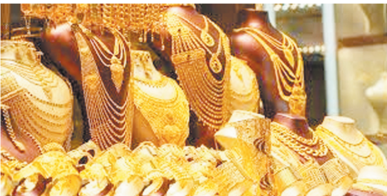
के लिए धारणा सकारात्मक बनी हुई है। पिछले साल सोने और चांदी ने अच्छे प्रदर्शन किया था। इससे इस साल भी निवेशकों को इनमें अच्छे कमाई की उम्मीद है। आर्थिक स्थिति में

नई दिल्ली, एजेंसी। विशेषज्ञों का अनुमान है कि संवत् 2081 में सोना 15-18 फीसदी तक का रिटर्न दे सकता है। इसकी वजह है मजबूत इकोनॉमिक फैक्टर और सुरक्षित निवेश की बढ़ती मांग। दिवाली से शुरू हुए संवत् 2081 को भारतीय निवेशक बहुत महत्वपूर्ण मानते हैं। यह हिंदू कैलेंडर के नए वित्त वर्ष की शुरुआत है। विश्लेषकों के मुताबिक, सोने और चांदी का प्रदर्शन पिछले संवत् 2080 में मजबूत रहा है। संवत् 2081