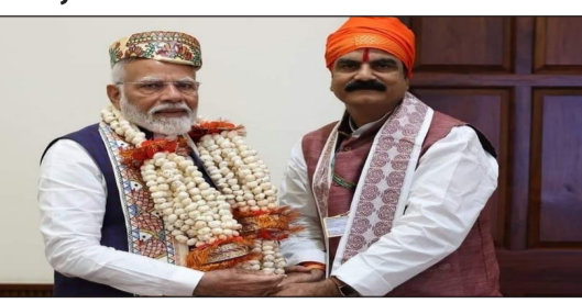
प्रातः किरण संवाददाता