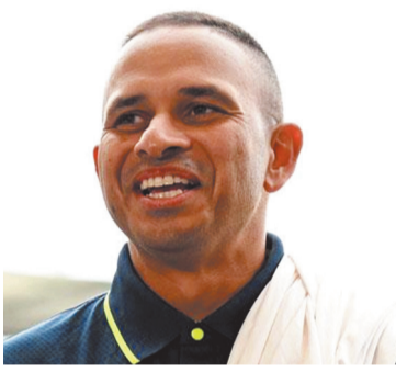
जोड़ीदार की तरह प्रतिभाशाली नहीं होता जो पारंपरिक प्रारूप में आसानी से तेजी से

को दोहराएं जो अब तक उनके लिए सफल रही है। ख्वाजा के हवाले से कहा, 'मुझे नहीं पता कि यह मिथक कहां से शुरू हुआ कि आपको कोई ऐसा खिलाड़ी चाहिए जो बहुत तेजी से रन बनाए। सलामी बल्लेबाज के रूप में आप रन बनाने का प्रयास करते हैं और इसके लिए आपके पास पंच दिन होते हैं। पिछले साल हमारा कोई टेस्ट मैच पांच दिन तक नहीं गया। सलामी बल्लेबाजों का मतलब रन बनाना और उस समय क्रीज पर डटे रहना है। वार्नर के बारे में बात करते हुए ख्वाजा ने कहा कि हर कोई उनके पूर्व सलामी