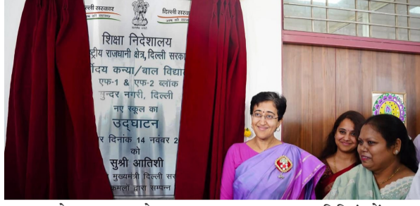
कलास एजुकेशन का हब बनेगा स्कूल; स्टूडेंट के लिए साइंस, कॉमर्स, आर्ट्स तीनों स्ट्रीम मौजूद होगी

इस मौके पर सीएम आतिशी ने कहा कि, सुंदर नगरी और नंद नगरी का इलाका दिल्ली की सबसे घनी आबादी वाले इलाके है। इस घनी आबादी वाले इलाके में पैर रखने तक की जगह नहीं है, लेकिन ऐसी जगह पर इतने शानदार वर्ल्ड क्लास स्कूल को देखकर विश्वास नहीं होता कि ये सुंदर नगरी-नंद नगरी इलाके के बीचो-बीच है। उन्होंने कहा कि, इस स्कूल का उद्घाटन करते हुए मुझे बहुत खुशी है क्योंकि 2015 में जब हमारी सरकार बनी और हम इस इलाके के स्कूलों में निरीक्षण के लिए जाते थे तो यहाँ हर क्लासरूम में 100-150 बच्चे बैठा करते थे। फर्श पर, टाट पट्टी पर बैठा करते थे। और जब एक क्लास में 150 बच्चे होंगे तब भगवान भी आ जाए तो बच्चों को अच्छी पढ़ाई नहीं मिल सकती है। 7000 बच्चों के लिए वर्ल्ड