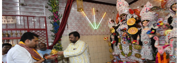
पटना, प्रातः किरण संवाददाता