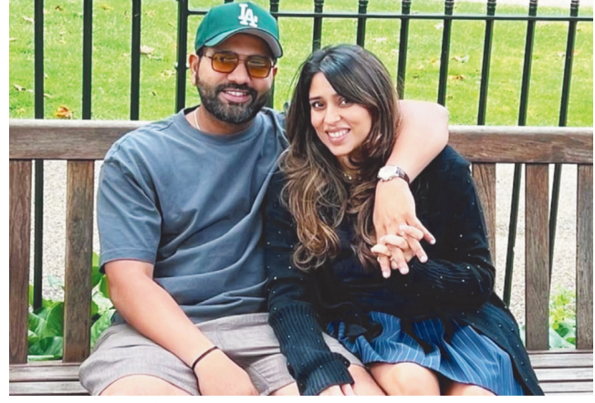
खिलाफ नहीं खेलेंगे। रोहित को लेकर चल रही इस खबर में कितना दम - अब पहले

नई दिल्ली, एजेंसी। क्या रोहित शर्मा दूसरी बार पापा बनने वाले हैं? क्या वो इस वजह से न्यूजीलैंड के खिलाफ 3 मैचों की टेस्ट सीरीज में नहीं खेलेंगे? जी नहीं ऐसा हम कतई नहीं कह रहे। बल्कि ऐसी अफवाह सोशल मीडिया पर चल रही है। सवाल है कि इस खबर का पूरा सच क्या है? सोशल मीडिया पर रोहित के दूसरी बार पिता बनने की खबर पहले भी चर्चा में आई थी। तब रोहित की पत्नी रितिका का एक वीडियो सोशल मीडिया पर वायरल हुआ था, जिसे देख लोगों ने कयास लगाने शुरू कर दिए थे। लेकिन, इसे लेकर आधिकारिक पुष्टि ना तो तब थी और ना अब जब कहा जा रहा है कि उसी के चलते वो न्यूजीलैंड के