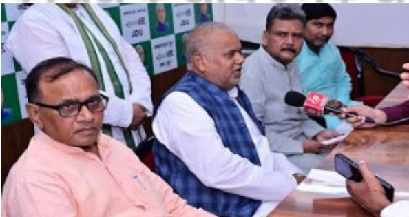
पटना, प्रातः किरण संवाददाता