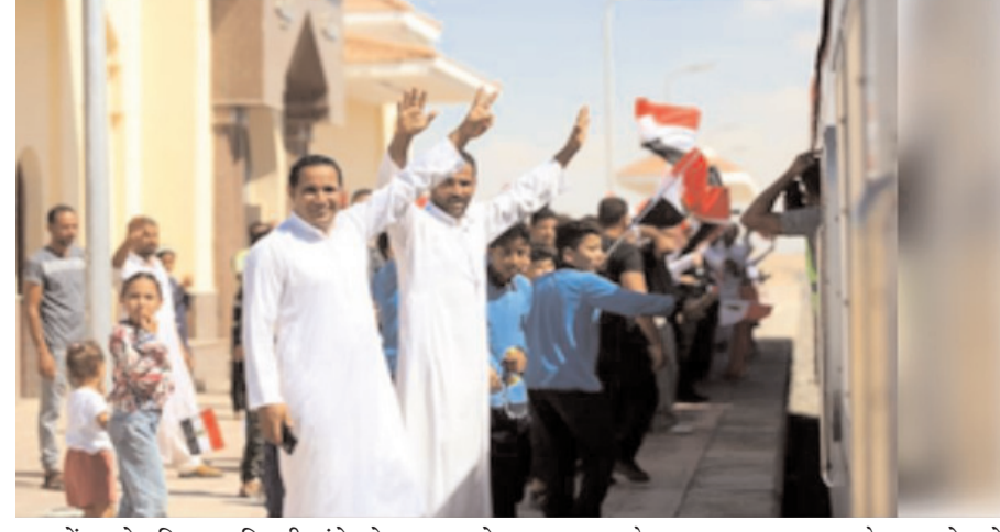
रूप में अपने परिवहन बुनियादी ढांचे को उन्नत करने के लिए काम कर रहा है। 1973 के अरब-इजरायल युद्ध के बाद क्षेत्र में संघर्ष और सैन्य अभियानों के कारण सिनाई में ट्रेन

काहिरा, एजेंसी। मिस्र के उत्तरी सिनाई में आधी सदी से भी अधिक समय बाद फिर से रेल सेवा शुरू होगी। यहां 100 किलोमीटर लंबे रेलमार्ग का ट्रायल ऑपरेशन शुरू हो गया है। मिस्र के परिवहन और उद्योग मंत्री कामेल अल-वजीर ने उद्घाटन समारोह में कहा, इस लाइन के शुरू होने से सिनाई से अन्य प्रांतों तक लोगों और माल की आवाजाही आसान हो जाएगी, नए शहरी इलाकों और औद्योगिक क्षेत्रों के विकास को बढ़ावा मिलेगा, उत्तरी सिनाई में आर्थिक परियोजनाओं को समर्थन मिलेगा। सिन्हुआ समाचार एजेंसी की रिपोर्ट के अनुसार, अल-फरदान-बीर अल-अब्द लाइन सिनाई प्रायद्वीप में रेल संपर्क को आधुनिक बनाने और विस्तार देने के उद्देश्य से एक बड़े प्रोजेक्ट का पहला चरण है। मिस्र के परिवहन और उद्योग मंत्रालय ने अल-फरदान को ताबा से जोड़ते हुए लाइन को लगभग 500 किलोमीटर तक विस्तारित करने की घोषणा की। मिस्र एक व्यापक आर्थिक सुधार कार्यक्रम के हिस्से के