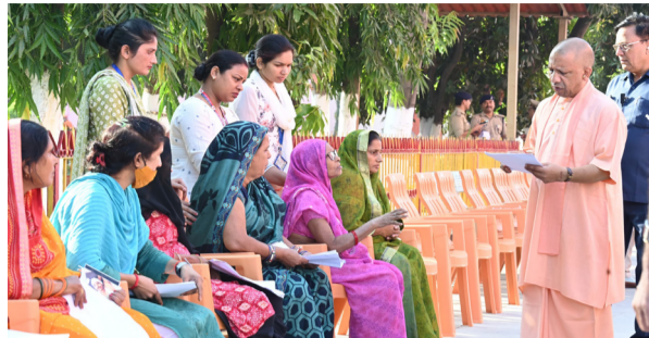
हुई तो संबंधित अधिकारी के खिलाफ कार्रवाई भी सुनिश्चित की जाएगी।

गोरखपुर, । उत्तर प्रदेश के मुख्यमंत्री योगी आदित्यनाथ ने शनिवार को अधिकारियों को चेतावनी दी कि जन समस्याओं के निस्तारण और पीड़ितों की मदद में विलंब या लापरवाही किसी भी दशा में नहीं होनी चाहिए तथा यदि लापरवाही हुई तो संबंधित अधिकारी के खिलाफ कार्रवाई भी सुनिश्चित की जाएगी।