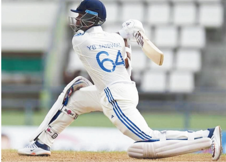
जायसवाल ने तेंदुलकर की बराबरी कर ली जिन्होंने 5 बार ऐसा किया था। टेस्ट की एक पारी में सबसे ज्यादा बार 3 या उससे ज्यादा छक्के लगाने वाले बल्लेबाजों की लिस्ट में पहले नंबर पर ऋषभ पंत और रोहित शर्मा हैं जिन्होंने 11-11 बार ऐसा किया था।

यशस्वी जायसवाल ने टेस्ट की किसी पारी में 5वीं बार 3 या उससे ज्यादा छक्के लगाने का कमाल किया। भारत की तरफ से टेस्ट की एक पारी में 3 या उससे ज्यादा छक्के लगाने वाले बल्लेबाजों की लिस्ट में यशस्वी 11-11 बार ऐसा किया था।