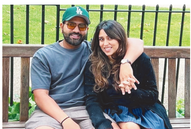
खिलाफ नहीं खेलेंगे। रोहित को लेकर चल रही इस खबर में कितना दम - अब पहले