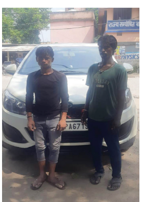
प्रातः किरण संवाददाता

विश्वकर्मा पूजा पर वाशिंग सेंटर में गाड़ियों की हुई भीड़