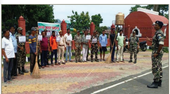
प्रातः किरण संवाददाता

एसएसबी के जवानों ने स्वच्छता अभियान का दायरा बढ़ाया, इको पार्क और जंगल कैम्प की सफाई की