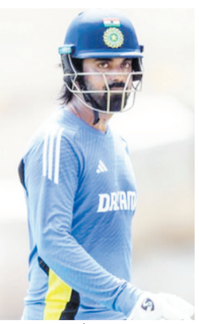
उन्हें इसलिए भी बैक किया था क्योंकि ये वो

चेन्नई, एजेंसी। टीम इंडिया और बांग्लादेश के बीच पहला टेस्ट गुरुवार (19 सितंबर) से चेन्नई में खेला जाएगा। यह मुकाबला लाल मिट्टी की पिच पर खेला जाएगा, जो तेज गेंदबाजों के लिए मददगार मानी जाती है। हालांकि, वक के साथ-साथ पिच का मिजाज भी बदलेगा। पिच, प्लेइंग-11 और टीम कॉम्बिनेशन को लेकर कई बातें उठी लेकिन इस बीच केएल राहुल का जिफ्र भी हुआ। सवाल यह है कि आखिर टीम इंडिया का क्राइसिस मैनेजर, हर किसी का सॉफ्ट टारगेट क्यों बन गया? दोनों टीमों को लेकर बयानबाजी तेज हो गई है। इन सबके बीच कप्तान रोहित शर्मा ने प्रेस कॉन्फ्रेंस की। पीसी में रोहित से केएल राहुल और सरफराज खान को लेकर सवाल किया गया। रोहित ने सीधे तौर पर राहुल का समर्थन किया। लेकिन सोचने वाली बात ये है कि हर सीरीज शुरू होने के पहले टीम में केएल राहुल की पोजीशन पर सवाल आखिर क्यों? इसका एक सबसे बड़ा कारण है कि लंबे समय तक खराब फॉर्म से जूझ रहे केएल राहुल को टीम ने हमेशा सपोर्ट किया और उन्हें मौके दिए। हालांकि, वो दौर अब बीत चुका है और केएल राहुल काफी हद तक टीम में जगह बनाने के हकदार हैं। कोच या कप्तान