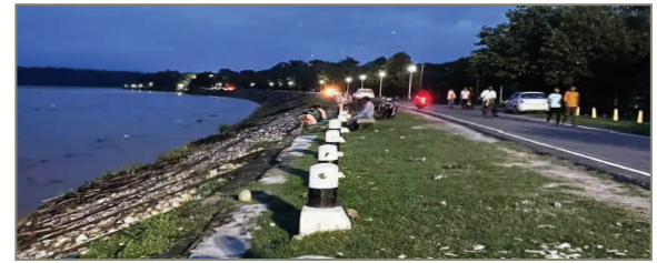
प्रातः किरण संवाददाता

बगहा समेत पर्यटन नगरी में गर्मी और उमस से लोग हुए बेहाल