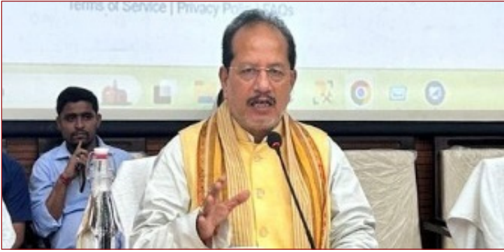
प्रातः किरण संवाददाता

2100 करोड़ की परियोजनाओं को मिली हरी झंडी