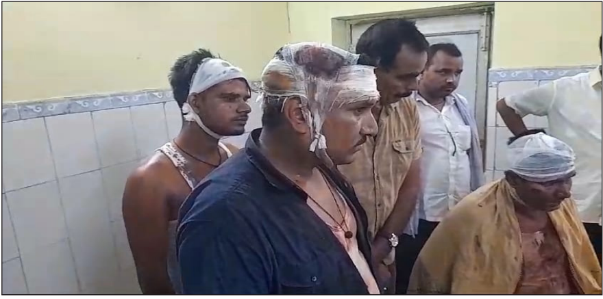
वही इस घटना की सूचना प्राप्त होने पर मढ़ौरा पुलिस हरकत में आई और