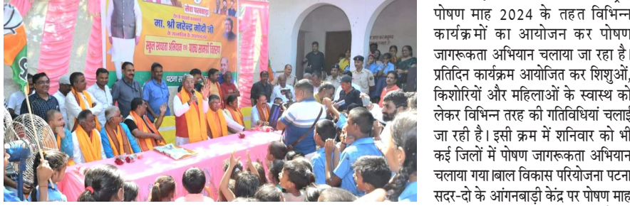
● विधान सभाध्यक्ष ने स्कूली बच्चों को बीच पाठ्य सामग्रीयों का किया वितरण, पौधारोपण भी किया