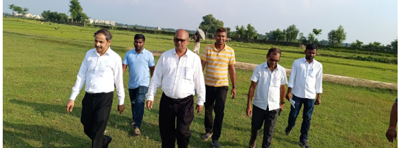
● दिल्ली से उपमहाबंटक के साथ आई टीए ने किया सर्वे