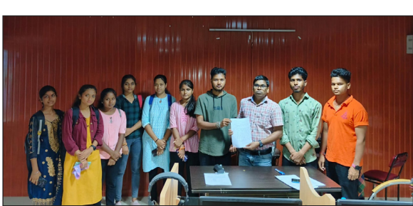
प्रातः किरण संवाददाता

जमुई [ झाड़ा ] छात्र-छात्राओं ने कहा कि मुंगेर विश्वविद्यालय मुंगेर द्वारा आयोजित सत्र 23-27 के सेमेस्टर 2 की परीक्षा पेपर पर्सनैलिटी डेवलपमेंट एंड कम्प्युनिकेशन के प्रश्न पत्र सिर्फ अंग्रेजी में आए थे। प्रश्न पत्र का हिंदी में अनुवाद नहीं होने की वजह से हम जैसे हजारों