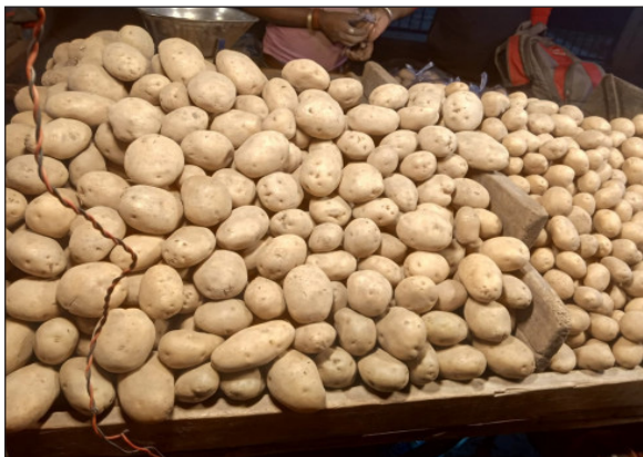
झेलनी पड़ती है। इस संदर्भ में सबसे

गिद्धौर प्रखंड क्षेत्र में इन दिनों मनमानी कीमत पर आलू बिक रहा है। बाजार में इसकी कीमत 35 प्रति किलो है। अब ऐसा नहीं है कि इसका फायदा सीधे तौर पर किसानों को मिल रहा है। आलू उत्पादन के बावजूद इसके मुनाफे को डोर बाजार के पास है। कुल मिलाकर आलू का बाजार एक स्टैबल के अधीन चलता है जहां सबसे ज्यादा मार उपभोक्ताओं को