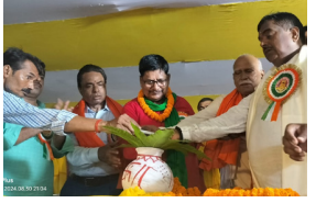
बधाई शुभकामना देता बाबा गणिनाथ हमारे कुल देवता भी हैं और पलवैया धाम के इस धरती पर बाबा गणिनाथ जी का अवतरण आया, दुराचार, अत्याचार, शोषण- दमन समीचीन सोच के खिलाफ प्रयत्नों से सभया कर मानव कल्याण के लिए हुआ था जिस तरह से बाबा गणिनाथ जी ने राक्षसों से लड़ते हुए उनका सभया कर अस्तय पर सत्य की विजय दिलाई इसलिए आज उनके कृति से प्रभावित हो हर वर्ष उनका जयंती के रूप में याद करते हैं मैं उनके रास्ते पर चलते हुए मैं सड़क से लेकर संसद तक जन कल्याण की लड़ाई लड़ने का संकल्प लेता हूँ लोक देवताओं में सबसे प्रसिद्ध बाबा गणिनाथ