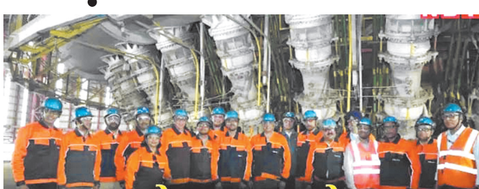
दौरान एक लाख करोड़ रुपये से अधिक का निवेश किया गया है।

कलिंग नगर (ओडिशा), एंजेंसी। देश में स्टील बनाने की शुरुआत करने वाली कंपनी टाटा स्टील ने फिर कमाल किया है। कंपनी ने ओडिशा के कलिंगनगर में एक अत्याधुनिक ब्लास्ट फर्नेस की कल कमीशन की है। कंपनी का दावा है कि यह भारत का सबसे बड़ा ब्लास्ट फर्नेस है। इस परियोजना के तहत कंपनी ने वहां 27,000 करोड़ रुपये का भारी-भरकम निवेश किया है। इस फर्नेस के शुरू होने के साथ ही कलिंगनगर प्लांट की उत्पादन क्षमता 3 मिलियन टन प्रति वर्ष से बढ़कर 8 एमटीपीए तक पहुंच जाएगी। इसका अब टाटा स्टील के शेयर पर भी असर दिखेगा।