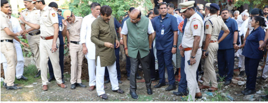
हा है जबकि, सड़के गड़बों से टूटी हुई हैं। कूड़े के ढेर लगे हैं। सीवर बैक फ्लो कर रहे हैं और लोगों को जलभराव को परेशानी का भी सामना करना पड़ रहा है। उन्होंने एक्स पर तस्वीरें जारी करके हुए कहा कि ये तस्वीरें दिल्ली का सच बयान करती हैं। उप राज्यपाल ने तंज करती हुए लिखा है कि आशा है कि जो लोग इस दुर्दशा के लिए

दिल्ली के उप राज्यपाल वीके सक्सेना ने उत्तर पूर्वी दिल्ली के अलग-अलग इलाकों में नालों की सफाई नहीं होने पर नाराजगी जताई है। उन्होंने सोशल माध्यम एक्स पर तस्वीरें जारी करके कहा है कि दिल्लीवासियों की बेबसी का एक और आयाम देखने को मिला। उन्होंने एक्स पर लिखा है कि निरीक्षण के दौरान उन्हें देश की राजधानी दिल्ली का वीथत्स रूप देखने को मिला। 200 फीट का गोकुलपुरी नाला वर्षों से गाद नहीं निकाले जाने के कारण 20-25 फीट का रह गया