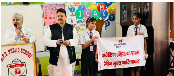
करते हुए कहा कि अवेकनिंग इंडिया और एम.पी.एस. स्कूल के सहयोग से गाजियाबाद के स्कूल में बच्चों को रेबीज मुक्त रहने की जानकारी लगातार दी जा रही है और अब तक लगभग 700 स्कूली बच्चों तक यह

जब बात स्वास्थ्य से जुड़ी हो तो हमें आम लोगों से लेकर स्कूली बच्चों में जागरूकता पैदा करने के उपाय अवश्य बताना चाहिए। इसी क्रम में रेबीज से कैसे बचें इस पर गाजियाबाद के जाने माने नाक, कान और गले के वरिष्ठ डॉक्टर और अवेकनिंग इंडिया के डायरेक्टर डॉक्टर बी.पी.एस त्यागी ने यह जानकारी आज एम.पी. एस. पब्लिक स्कूल संजय नगर में बच्चों को गाजियाबाद रेबीज मुक्त अभियान के अंतर्गत दी। उन्होंने बच्चों और स्कूल की अध्यापिकाओं को सम्बोधित