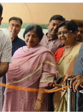
शीर्षक से उनके अध्ययनशील व्यक्तित्व और ज्ञान के प्रति रुचि को रेखांकित किया गया। फोटो प्रदर्शनी का प्रमुख आकर्षण नरेंद्र मोदी के राजनीतिक जीवन की विभिन्न झलकियों को प्रदर्शित करने

वाला खंड था। पावरफुल सीएम शीर्षक से गुजरात के मुख्यमंत्री के रूप में उनके कार्यकाल की झलक दिखाई गई जहां उन्होंने विकास के नए मापदंड स्थापित किए। वीआईपी कल्चर को गुडबाय में उनके द्वारा