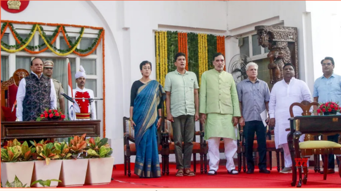
केजरीवाल की उतराधिकारी और सीएम चेहरा आतिशी