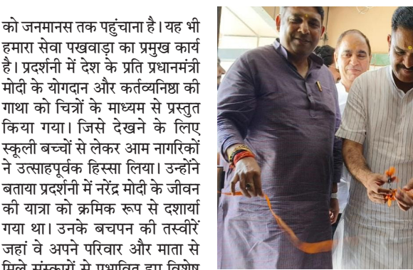
को जनमानस तक पहुंचाना है। यह भी हमारा सेवा पखवाड़ा का प्रमुख कार्य है। प्रदर्शनी में देश के प्रति प्रधानमंत्री मोदी के योगदान और कर्तव्यनिष्ठा की गाथा को चित्रों के माध्यम से प्रस्तुत किया गया। जिसे देखने के लिए स्कूली बच्चों से लेकर आम नागरिकों ने उत्साहपूर्वक हिस्सा लिया। उन्होंने बताया प्रदर्शनी में नरेंद्र मोदी के जीवन की यात्रा को क्रमिक रूप से दर्शाया गया था। उनके बचपन की तस्वीरें जहां वे अपने परिवार और माता से मिले संस्कारों से प्रभावित हुए विशेष आकर्षण का केंद्र रहें। देश भक्ति की शक्ति शीर्षक के एक खंड में मोदी के राष्ट्रप्रेम और उनकी प्रारंभिक शिक्षा से जुड़े क्षणों को दिखाया गया जो देश के युवा वर्ग के लिए प्रेरणास्रोत बने। इसी क्रम में किताबों के समंदर के गोताखोर