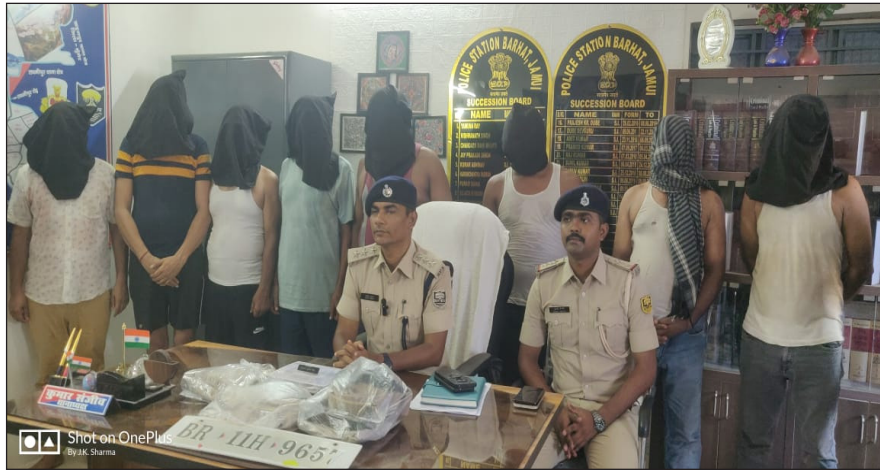
जिसका रजिस्ट्रेशन नंबर बी आर 11 एच 9657 है। सभी आरोपी पुलिस के वर्दी में लोगों को डरा धमकाकर लूटपाट करता था। पुलिस की पूछताछ में यह प्रारम्भिक जानकारी मिली है कि यह एक संगठित गिरोह है जो भोलेभाले लोगों को टावर लगाने, पैसा

जमुई/बरहट/एसएनबी। थाना क्षेत्र अंतर्गत मंगलवार 30 जुलाई को अज्ञात आरोपियों ने एक युवक के साथ हुई लूट की घटना को अंजाम दिया था। बदमाश करीब 60000 रुपए लेकर फरार हो गए थे। बरहट थाना को सूचना संध्या सात बजे सूचना प्राप्त हुआ की एक युवक से 60,000 रुपया लूट कर एक सफेद रंग की स्कॉर्पियो गाड़ी से 08 व्यक्ति लखीसराय की तरफ भाग रहे हैं। सूचना मिलने के उपरान्त पुलिस अधीक्षक जमुई के निर्देशानुसार एक विशेष टीम द्वारा सभी महत्वपूर्ण पॉइंट्स पर चेकिंग और नाकेबंदी लगाई गई एवं पुलिस की सक्रियता से तक्षण कांड में सिलिप सभी 08 अभियुक्तों को पकड़ा गया। गिरफ्तार अभियुक्तों के पास से 1,00,000 नगद जिसमें 60,000 के पीड़ित से छीना गया 60,000 रुपया बरामद किया गया तथा एक सफेद स्कॉर्पियो भी बरामद किया गया