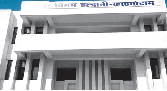
लिए सिंधी चौराहे से रोडवेज तक और मंगलपड़ाव तक कई सरकारी अतिक्रमण हटाने का काम है। सड़क के दोनों ओर स्थित 101 दुकान, भवन, प्रतिष्ठान, एक धार्मिक स्थल के स्वामियों व प्रबंधन को नोटिस जारी कर स्वयं अपना अतिक्रमण हटाने को कहा था लेकिन

नैनीताल, एजेंसी। हल्द्वानी नगर निगम ने नैनीताल रोड पर मंगलपड़ाव से रोडवेज चौराहे तक सड़क के मध्य बिंदु से दोनों ओर 12 मीटर क्षैतिज दूरी पर निर्मित भवनों के कब्जेदारों से कहा है कि वह प्रशासन की ओर से पूर्व में चिह्नित अतिक्रमण को 23 अगस्त तक स्वयं हटा लें। हल्द्वानी नगर निगम ने नैनीताल रोड पर मंगलपड़ाव से रोडवेज चौराहे तक सड़क के मध्य बिंदु से दोनों ओर 12 मीटर क्षैतिज दूरी पर निर्मित भवनों के कब्जेदारों से कहा है कि वह प्रशासन की ओर से पूर्व में चिह्नित अतिक्रमण को 23 अगस्त तक स्वयं हटा लें। प्रशासन की ओर से इस संबंध में आज से मुनादी कराई जाएगी। जिला प्रशासन ने नैनीताल रोड के चौड़ीकरण के