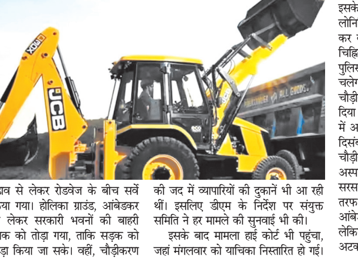
मंगलपड़ाव से लेकर रोडवेज के बीच सर्वे की मद में व्यापारियों को दुकानों भी आ रही शुरू किया गया। होलिका ग्राउंड, आंबेडकर पार्क से लेकर सरकारी भवनों की बाहरी दीवार तक को तोड़ा गया, ताकि सड़क को और चौड़ा किया जा सके। वहीं, चौड़ीकरण