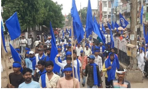
जिस तरह से सुप्रीम कोर्ट द्वारा आरक्षण यानी लागू करने का आदेश दिया गया है वो पूर्णतः कोटे में कोटा का उपवर्गीकरण एवं क्रिमिलियर असंवैधानिक है। उन्होंने आरोप लगाया है कि

रोहतास (बिहार)। सुप्रीम कोर्ट द्वारा आरक्षण में क्रीमिलेयर लागू करने के फैसले के विरोध में आज विभिन्न संगठनों के द्वारा भारत बन्द का ऐलान किया गया था। जिसका असर रोहतास जिले के देहरी में भी देखा गया आरक्षण बचाओ संविधान बचाओ संघर्ष मोर्चा के हजारों कार्यकर्ताओं ने डेहरी शहर को पूरी तरह से बंद कराया एवं सुप्रीम कोर्ट के आदेश का विरोध किया इसके साथ ही केंद्र सरकार के खिलाफ जमकर नारेबाजी की। प्रदर्शनकारियों का कहना है कि मोर्चा कि