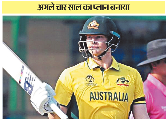
अगले चार साल का प्लान बनाया

नई दिल्ली (एजेंसी)। ऑस्ट्रेलिया के स्टार बल्लेबाज स्टीव स्मिथ लॉस एंजिल्स 2028 ओलंपिक में देश का प्रतिनिधित्व करने पर हैं, जो टी20 प्रारूप में खेले जाने की संभावना है। स्मिथ को इस साल जून में ऑस्ट्रेलिया की टी20 विश्व कप टीम से बाहर रखा गया था, लेकिन अनुभवी बल्लेबाज अपने टी20आई भविष्य के लिए प्रतिबद्ध हैं। उन्होंने बिग बैश लीग (बीबीएल) फेंचबाजी सिडनी सिक्सर्स के साथ तीन साल का नया करार किया है, जिसके तहत वह कम से कम 2026-27 तक टूर्नामेंट खेलते नजर आएंगे। हालांकि स्मिथ को ओलंपिक में खेलने के अपने सपने को पूरा करने के लिए टी20आई राष्ट्रीय टीम में अपना स्थान फिर से हासिल करना होगा।