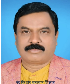
प्रातः किरण संवाददाता

एससी-एसटी के लिए आरक्षण के भीतर आरक्षण और क्रीमी लेयर कॉन्सेप्ट लागू करने का कोई औचित्य नहीं