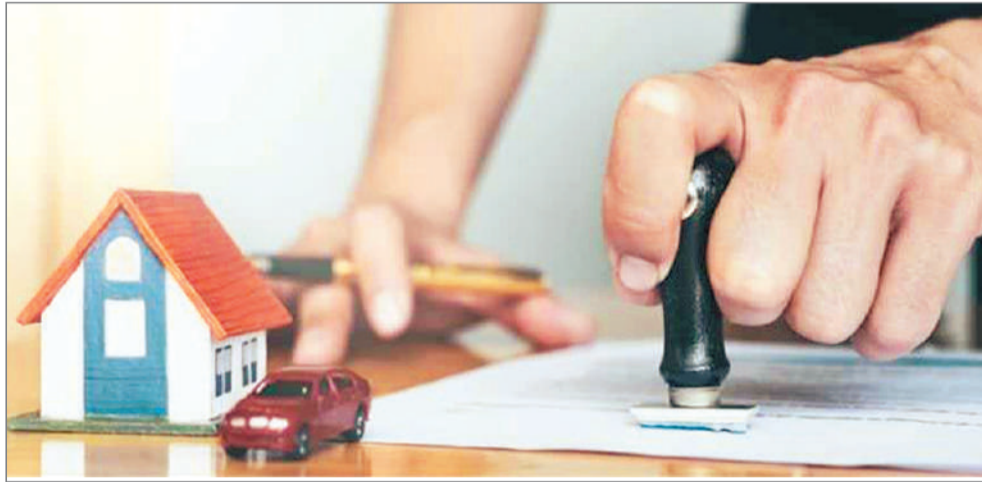
मध्य प्रदेश ने 8 फीसदी से घटकर 7.5 फीसदी किया है। 3 से 7 फीसदी था। छत्तीसगढ़ ने 8 से घटकर पांच फीसदी किया है। हरियाणा ने बढ़ाकर 5 से 7 फीसदी कर दिया है जो पहले

विदेशी निवेशकों ने जनवरी से जून के दौरान भारतीय रियल एस्टेट क्षेत्र में 3.1 अरब डॉलर का निवेश किया है। जेएलएल इंडिया की रिपोर्ट के अनुसार, कुल निवेश का करीब 65 फीसदी हिस्सा है। पिछले 10 वर्षों में कई राज्यों ने स्टांप शुल्क बढ़ाया है तो कई ने घटाया है। उत्तर प्रदेश ने सबसे ज्यादा 5.5 फीसदी घटाया है। इस राज्य में पहले स्टांप शुल्क 12.5 फीसदी था जो अब सात फीसदी है।