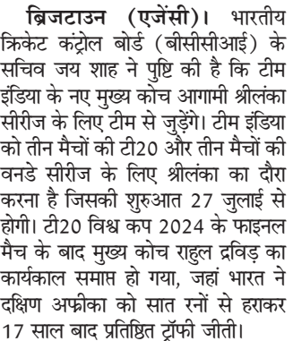
का साक्षात्कार लिया है और उन्हें शॉर्टलिस्ट किया है। उन्होंने कहा कि मुंबई पहुंचने के बाद बीसीसीआई के सदस्य इसकी घोषणा करेंगे। बीसीसीआई सचिव

ब्रिजटाउन (एजेंसी)। भारतीय क्रिकेट कंट्रोल बोर्ड (बीसीसीआई) के सचिव जय शाह ने पुष्टि की है कि टीम इंडिया के नए मुख्य कोच आगामी श्रीलंका सीरीज के लिए टीम से जुड़ेंगे। टीम इंडिया को तीन मैचों की टी20 और तीन मैचों की वनडे सीरीज के लिए श्रीलंका का दौरा करना है जिसकी शुरुआत 27 जुलाई से होगी। टी20 विश्व कप 2024 के फाइनल मैच के बाद मुख्य कोच राहुल द्रविड़ का कार्यकाल समाप्त हो गया, जहां भारत ने दक्षिण अफ्रीका को सात रनों से हराकर 17 साल बाद प्रतिष्ठित ट्रॉफी जीती।