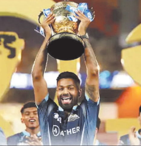
उनके पास टी-20 इंटरनेशनल में 100 मैचों का अनुभव है, जो अन्य किसी दावेदार के पास नहीं है। पंड्या ने 16 टी-20 इंटरनेशनल मैचों में भारत की कप्तानी की है, इनमें से टीम ने 10 मुकाबले जीते।

त्रभ्रम पंत - जीत का खतरनाक साबित हो रहे कप्तान और मिलर को पवेलियन भेजने वाले हार्दिक पंड्या होंगे, प्लेयर ऑफ द टूर्नामेंट जसप्रीत बुमराह या फिर मौत को मात देकर वर्ल्ड चैंपियन बनने वाले मिर्रेकल मैन त्रभ्रम पंत होंगे। हार्दिक पंड्या - हार्दिक पंड्या कप्तान बनने के दावेदारों की रेंस में सबसे आगे