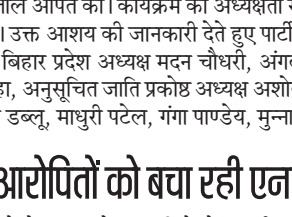
पटना, प्रातः किरण संवाददाता