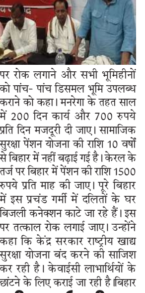
पटना, प्रातः किरण संवाददाता