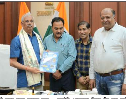
को जल्द से जल्द चालू कराया जाए, जिससे स्थानीय लोगों को उसका लाभ मिल सके। उनसे यह अनुरोध किया कि एक बार स्वयं स्थल का निरीक्षण कर वस्तुस्थिति देख लें। उन्होंने आश्चर्य व्यक्त किया कि हम उसे देखेंगे। आप लोग बताएं कि वहां क्या काम मिल सके। उनसे यह अनुरोध किया कि एक बार स्वयं स्थल का निरीक्षण कर वस्तुस्थिति देख लें।