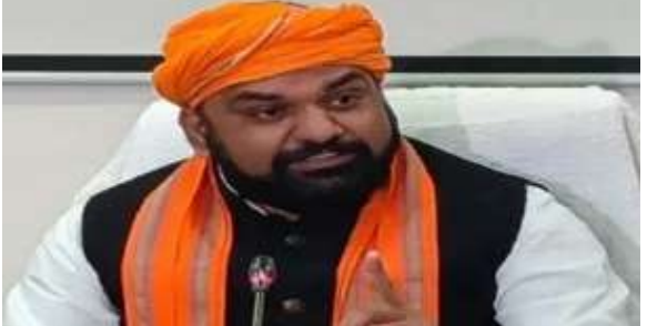
● कांग्रेस अपने पाप को छुपाने के लिए झूठा नैरेटिव गढ़ रही है

25 जून सदैव भारत के इतिहास में काला दिन के रूप में जाना जाएगा