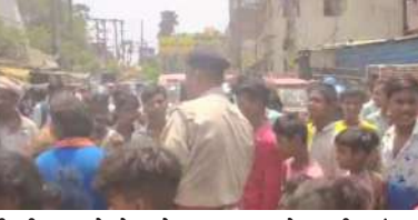
नारा बाजी भी कर रहे थे। रोड जाम किए लोगों का कहना था कि उच्च प्रवाही बोरिंग पंप में पिछले पांच दिनों से आयी गड़बड़ी के कारण बाजार समिति, बहादुरपुर स्लम बस्ती,

नगर निगम के वार्ड संख्या 47 के साकेतपुरी मुहल्ला स्थित उच्च प्रवाही बोरिंग बोरिंग पांच दिनों से खराब है। इस कारण से करीब एक दर्जन मुहल्लों में पानी की समस्या बनी है। इस गमी में पानी का संकट झेल रहे बहादुरपुर थाना क्षेत्र के बाजार समिति स्लम बस्ती के लोगों ने सड़क जाम कर हंगामा किया। सड़क पर दोनों ओर बांस बेराबंद करने के साथ ही