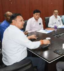
पटना, प्रातः किरण संवाददाता

पटना नगर निगम द्वारा टाउन वेंडिंग कमिटी की बैठक का आयोजन सोमवार को किया गया। बैठक के दौरान नगर आयुक्त एवं फुटपाथी विक्रेता एवं विभिन्न एसोसिएशन के साथ विस्तृत चर्चा की गई। बैठक के दौरान नगर आयुक्त द्वारा निर्देश दिया गया कि शहर के सभी वेंडिंग जोन और वेंडर को वार्ड वार स्थान चिन्हित कर दिया जाएगा। नगर निगम की वो वेंडिंग जोन बने हूए है उन्हें लॉटरी सिस्टम के माध्यम से जगह उपलब्ध कराया जाएगा।