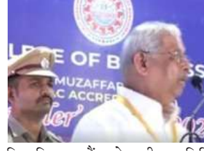
पटना, प्रातः किरण संवाददाता