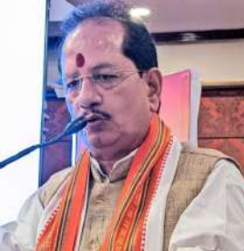
पटना, प्रातः किरण संवाददाता