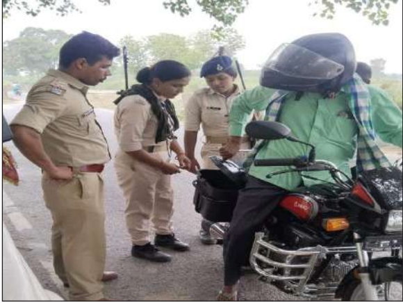
किया गया इस संबंध में भितहॉ थाना द्वारा अग्रतर कार्रवाई की जा रही है।