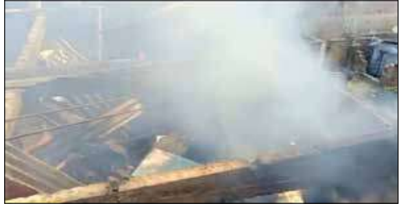
पटना सिटी, प्रातःकिरण संवाददाता

चौक थाना क्षेत्र के चौकशिकारपुर काली स्थान के पास एक मकान में बुधवार को अपराह्न में आग लग गई। आग लगने से करीब दो लाख की रुपए की संपत्ति जल गयी है। आग लगने का कारण स्पष्ट नहीं है। आशंका है कि शॉर्ट सर्किट की वजह से यह घटना हुई होगी। कुछ स्थानीय लोगों का कहना था कि मीटर में आग लगने के कारण घर में आग पकड़ लिया। आग लगने की सूचना मिलते ही मौके पर एक बड़ी और छोटी यूनिट आग बुझाने के लिए सिटी फायर स्टेशन से पहुंची। रास्ता के संकरा होने के कारण बड़ी यूनिट बाहर खड़ी रही, जबकि किसी तरीके से नैनो मिस्ट टेक्नोलॉजी की गाड़ी को अंदर तक