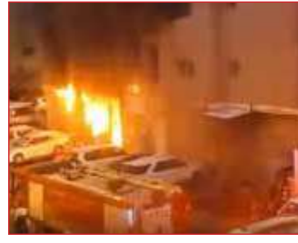
करने के निर्देश दिए हैं।

गए। जिस इमारत में यह भीषण आग लगी, उसमें 160 लोग मौजूद थे और सभी एक ही संस्थान में काम करते हैं। बताया गया है कि इन मजदूरों में कई भारत के रहने वाले थे। इमारत के मालिक को गिरफ्तार करने का आदेश: कुवैत के आंतरिक मामलों के मंत्री शेख फहद अल-यूसुफ अल-सबा ने पुलिस को मंगफ स्थित इमारत के मालिक को गिरफ्तार करने का आदेश दिया। उन्होंने स्पष्ट तौर पर कहा है कि इस हादसे के जिम्मेदार कंपनी और बिल्डिंग के मालिक हैं। उन्होंने कुवैत प्रशासन और नगर पालिका को इस मामले में सख्त से सख्त कार्रवाई