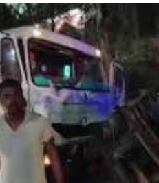
त्रिवेणीगंज शहर के दुर्गा मंदिर के पास तेज रफ्तार ट्रक ने ऑटो रिक्शा

सुपौल। बिहार में सुपौल जिले के त्रिवेणीगंज थाना क्षेत्र में बुधवार तड़के ट्रक और ऑटो रिक्शा के बीच हुई टक्कर में चार लोगों की मौत हो गयी, तथा दो अन्य लोग गंभीर रूप से घायल हो गये। पुलिस सूत्रों ने यहां बताया कि त्रिवेणीगंज इलाके के डपरखा गांव में भगवान शिव की पूजा करने के बाद कुछ लोग ऑटो रिक्शा से अपने घर जा रहे थे। इसी बीच