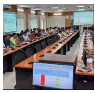
नापी काराकर, लेआउट कराते हुए अविलंब कार्य प्रारंभ कराना सुनिश्चित किया जाय। लैंड इश्यू को एक सप्ताह के अंदर क्लीयर करें। 25 जून तक हर हाल में कार्य प्रारंभ कराना सुनिश्चित करेंगे।

कराना है। इसके साथ ही लंबित योजनाओं को त्वरित गति से कार्य करते हुए पूर्ण कराना सुनिश्चित किया जाय। उन्होंने कहा कि डब्ल्यूपीयू निर्माण हेतु निर्धारित लक्ष्य के विरुद्ध कुछ प्रखंडों द्वारा बेहतर कार्य किया गया है, जो सराहनीय है। वहीं कुछ प्रखंडों द्वारा चिन्हित स्थलों पर कार्य शुरू नहीं कराया गया है। जो अर्थात् ही निराशाजनक है। उन्होंने निर्देश दिया कि जिन स्थलों पर अबतक कार्य प्रारंभ नहीं हुआ है, वहां