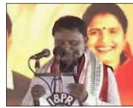
सीएम नवीन पटनायक भी शपथ ग्रहण समारोह में शामिल हुए। चार बार एक ही विधानसभा क्षेत्र से जीत हासिल करने वाले माझी पर इस बार भारतीय जनता पार्टी ने भरोसा जताया और उन्हें ओडिशा का 15वां मुख्यमंत्री नियुक्त किया है। आपको बता दें कि इस बार ओडिशा विधानसभा चुनाव में भारतीय जनता पार्टी ने राज्य में बीजू जनात दल के विजयधर को रोका और बड़ी जीत दर्ज की। 1147 में से 78 सीटों पर जीत हासिल कर भारतीय जनता पार्टी ओडिशा में सबसे बड़ा दल बनकर उभरी। पार्टी ने मुख्यमंत्री पद का उम्मीदवार घोषित किए बिना पीएम मोदी के नेतृत्व में चुनाव लड़ा था। उधर, बीजू जनात दल को 51 सीटों पर जीत हासिल हुई।

भुवनेश्वर। ओडिशा में पहली बार भाजपा की सरकार बनी। क्योहार से विधायक मोहन चरण माझी ने बुधवार को भाजपा के पहले मुख्यमंत्री के रूप में शपथ ली। उनके साथ केवी सिंह देव और प्रभाती परिदा ने राज्य के उप मुख्यमंत्री के रूप में शपथ ली। इसी के साथ ओडिशा में पहली बार एक सीएम, दो डिप्टी सीएम और 13 मंत्रियों की सरकार बनी। शपथ ग्रहण समारोह शाम 5 बजे शुरू हुआ। इस कार्यक्रम को भुवनेश्वर के जलता मेदान में आयोजित किया गया। ओडिशा के मुख्यमंत्री के तौर पर मोहन चरण माझी के शपथ समारोह में शामिल होने के लिए प्रधानमंत्री नरेंद्र मोदी भुवनेश्वर पहुंचे। एयरपोर्ट पर ओडिशा के राज्यपाल रघुबर दास और स्वयं मोहन चरण माझी ने पीएम मोदी का स्वागत किया।