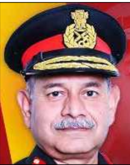
की दोपहर से मानी जाएगी, जब मौजूदा थलसेनाध्यक्ष जनरल पांडे सेवानिवृत्त होंगे। लेफ्टिनेंट जनरल उपेंद्र द्विवेदी इसी साल 15 फरवरी को उप सेना प्रमुख नियुक्त किए गए

नई दिल्ली/एजेंसी। देश के अगले थलसेनाध्यक्ष लेफ्टिनेंट जनरल उपेंद्र द्विवेदी होंगे। वह इस समय उप सेना प्रमुख के पद पर कार्यरत हैं। मौजूदा थलसेनाध्यक्ष जनरल मनोज सी पांडे 30 जून को पदमुक्त हो रहे हैं। उन्हें 31 मई को ही रिटायर होना था लेकिन सरकार ने उनका कार्यकाल एक माह के लिए बढ़ा दिया था। सेना प्रमुख जनरल मनोज पांडे ने 30 अप्रैल, 2022 को भारतीय सेना की बागडोर संभाली थी। उन्होंने दिसंबर, 1982 में कोर ऑफ इंजीनियर्स (बॉम्बे सैपर्स) में कमीशन मिला था। सीओएसएस का