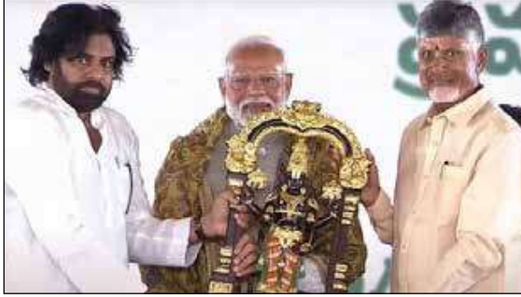
सम्मानित: नायडू और पवन कल्याण ने पीएम मोदी को भगवान की प्रतिमा किया भेंट