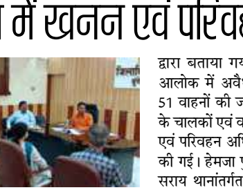
द्वारा बताया गया कि भवदीय के निर्देश के आलोक में अवैध बालू उत्खनन में लिस कुल 51 वाहनों की जांच की गई, जिसमें 49 वाहनों के चालकों एवं वाहन मालिकों के खिलाफ खनन एवं परिवहन अधिनियम के तहत प्राथमिकी दर्ज की गई। हेमजा पुर थानांतर्गत 25 तथा शाफिया सराय थानांतर्गत 24 प्राथमिकी दर्ज कार्रवाई हुई है। जिलाधिकारी ने उपस्थित सभी पदाधिकारियों को स्पष्ट शब्दों में कहा कि अवैध खनन में लिस माफियाओं के खिलाफ जोरो टॉलरेंस की नीति के तहत कार्य करें। जिलाधिकारी ने कहा कि विगत इत्रा कां में जरा भी अनियमितता न करें अन्यथा उनके विरुद्ध सख्त कार्रवाई की जायेगी। आप पूरी ईमानदारी से अपने कर्तव्यों का निर्वहन करें