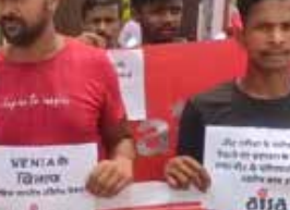
का रिजल्ट 14 जून को आना था उसे दस दिन पहले यनि लोकसभा रिजल्ट के दिन ही क्यों प्रकशित किया गया। आखिर ठळअ क्या छुपाना चाहती है और ये पहली बार होगा की सभी टॉपर को अक्करत जैसी कॉलेज ने नामांकन नहीं मिलेगी। उन्होंने कहा कि जब ठळअ हमेशा विवादों में रहा है तो ऐसे एजेंसी को किस आधार पर सरकार परीक्षा लेने को देती है। इस परीक्षा में काफी धांधली हुई है, सरकार इसे रद्द करे और पुनः परीक्षा ले।