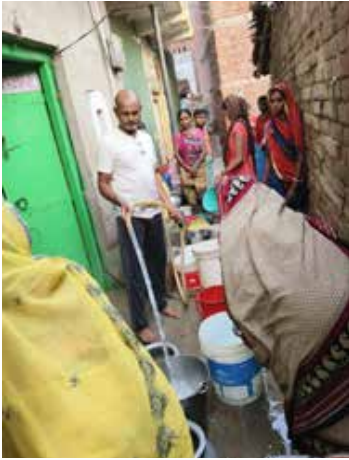
उन्होंने बताया की इस भीषण गर्मी में जहां नदी पोखर, आहर, तालाब, सहित बोरिंग में पानी सुख गया है। जिससे प्रखंड क्षेत्र में पानी का घोर समस्या उत्पन हो गया है। पानी के कमी का कारण है की तीन वर्षों से क्षेत्र में वर्षा सही से नहीं हो रहा है जिससे पानी का लेयर काफी नीचे चला गया। चापाकल सहित मोटर पानी उगलना बंद कर दिया। इसी परेशानी को देखते हुए हम रोज सुबह शाम अपने समरसेबुल मोटर से दर्जनों लोगों को पाने देते है। पानी के लिए अहले सुबह से ही पानी के लिए लंबी कतार लग जाती है। बारी बारी से सभी लोग पानी लेते है। जिससे लोगों को कुछ हद तक पेयजल आपूर्ति हो जाती है। वहीं कई गांवों में पानी की किल्लत से लोगों के रात की नींद भी आराम हो गई है। कई जगहों पर लोग पानी के लिए अन्यत्र जाग कर रहे हैं, फिर भी पेयजल आपूर्ति नहीं हो पा रही, इससे अनियमित

जमुई/ई० अलीगंज- अलीगंज प्रखंड क्षेत्र में इन दिनों भीषण गर्मी में सूरज ने अपना रौद्र रूप दिखा रहा है। सुबह से लेकर शाम तक सूरज से आग के गोले बरस रहे हैं। इससे पारा लगातार चढ़ता जा रहा है। भीषण गर्मी में सोमवार को 11 बजे का अधिकतम तापमान 44 डिग्री सेल्सियस रहा इसी से अंदाजा लगा सकते हैं। प्रचंड गर्मी से जीव जंतु सहित लोग परेशान है। जनजीवन अस्त-व्यस्त हो गया। घरों में एसी, कूलर, पंखा, सब हो गया फेल। एक तरफ सूरज के सख्त तेवर से गर्मी का सितम ढा रही है तो दूसरी तरफ पानी की घोर किल्लत से लोग एक बूंद पानी को तरस रहे है। भीषण गर्मी में जहां तासी सूरज से आहार पोखर सहित चापाकल से लेकर समरसेबुल मोटर तक दम तोड़ने लगा है। जिससे पानी के लिए कई जगहों पर हाहाकार मचा है। एक तरफ भीषण गर्मी में भूजल स्तर 20 से 30 फिट नीचे खिसकने से पंजल की समस्या से प्रखंड के लोग झेल रहे है। पानी के अभाव में लोगों के कंठ सूख