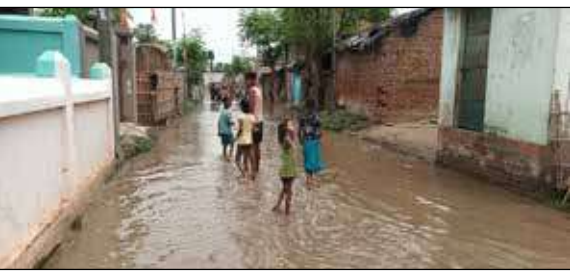
प्रतः किरण संवाददाता