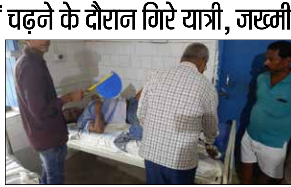
प्रतः किरण संवाददाता