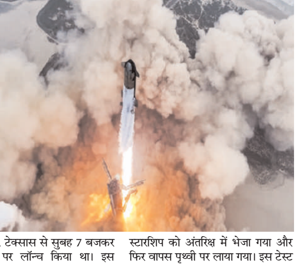
बोका चिका, टेक्सास से सुबह 7 बजकर स्टारशिप को अंतरिक्ष में भेजा गया और 50 मिनट पर लॉन्च किया था। इस फिर वापस पृथ्वी पर लाया गया। इस टेस्ट

का उद्देश्य यही था कि पता लगाया जाए कि स्टारशिप अंतरिक्ष में जाने के बाद जब दोबारा पृथ्वी का वातावरण में लौटता है तो सवाइंड कर पाता है या नहीं। कंपनी स्पेसएक्स ने भी सोशल मीडिया पर बताया कि पानी में लैंडिंग एकदम सफल रही है और इसके लिए स्पेसएक्स की टीम को बधाई। मंगल पर कॉलोनी बसाने का सपना देखने वाले एलन मस्क के लिए यह मिशन बहुत ही अहम था। यह रॉकेट पूरी तरह से रीयूजेबल है। एलन मस्क की कंपनी ने इसे बनाया है। स्टारशिप दरअसल एक स्पेसक्राफ्ट और सुपर हैवी बूस्टर का मिलाजुला रूप है। यह 150 मीट्रिक टन तक का भार अपने साथ ले जा सकता है। जानकारी के मुताबिक इसे इस तरह से तैयार किया गया है कि एक बार में कम से कम 100 लोगों को मंगल