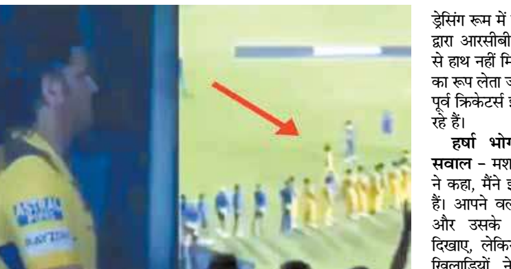
पारी खेलकर सीएसके को जीत भी दिलाई, लेकिन करो या मरो के मुकाबले में चोक कर गए। मैच खत्म होने के बाद डगाआउट से सीएसके की पूरी टीम लाइन लगकर ग्राउंड की ओर जा रही थी। सबसे आगे महेंद्र सिंह धोनी थे, लेकिन आरसीबी के प्लेयर्स अपने जश्न में मगन थे। ऐसे में येलो आर्मी को उनसे हाथ मिलाने के लिए थोड़ा इंतजार करना पड़ रहा था। हालांकि, थोड़ी देर रुकने के बाद माही ड्रेसिंग रूम में लौटने का फैसला करते हैं। धोनी के पीछे गए विराट - वापस लौटते वक्त थाला ने आरसीबी के सपोर्ट स्टाफ के मेंबर्स और कुछ बेंच खिलाड़ियों से हाथ मिलाया। एक अन्य वीडियो में यह देखा जा सकता है कि मैदान पर धोनी को नजरद देख विराट कोहली पीछे-पीछे उनसे मिलने

बेंगलूरु (एजेंसी)। क्या रॉयल चैलेंजर्स बेंगलूरु के खिलाफ बीती रात हुआ मुकाबला आईपीएल में धोनी का आखिरी मैच था। क्रिकेट वर्ल्ड यही उम्मीद कर रहा है कि ऐसा नहीं होगा। धोनी भी अपने सिग्नेचर स्टाइल में मैच फिनिश करके सीएसके को प्लेऑफ में कालीफाई करवाना चाहते थे। पहली गेंद पर छक्का मार भी दिया था, लेकिन यश दयाल ने अगली बॉल पर फंसा लिया। आरसीबी न सिर्फ मैच जीतने में कामयाब रही बल्कि प्लेऑफ में भी कालीफाई कर गई। अब मैच खत्म होने के बाद की घटना का वीडियो सोशल मीडिया पर वायरल हो रहा है। जहां धोनी विरोधी टीम आरसीबी के खिलाड़ियों से हाथ मिलाना छोड़कर वापस ड्रेसिंग रूम में लौटते नजर आ रहे हैं। इंतजार नहीं कर पाए धोनी - धोनी पूरी सीजन भर चोटिल घुटने के साथ मैच से ठीक पहले इंजेक्शन लेकर खेलते रहे। कुछ अच्छी कैमियो