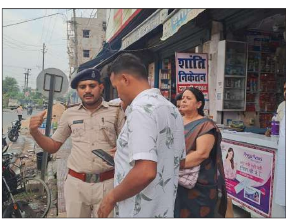
सोने की चेन पहन कर सुबह-शाम की सैर पर निकलना या किसी काम के लिए घर से निकलने व वापस आने वाली महिलाओं के गले से सोने के चेन की छिनतई की बढ़ती घटनाओं से लोगों के मन में डर समा गया है।

सोने की चेन पहन कर सुबह-शाम की सैर पर निकलना या किसी काम के लिए घर से निकलने व वापस आने वाली महिलाओं के लिए शहर अब सुरक्षित नहीं रह गया है। शहर में महिलाओं के गले से सोने के चेन की छिनतई की बढ़ती घटनाओं से लोगों के मन में डर समा गया है। बीते कुछ महीनों में शहर में चेन स्टेचिंग के साथ-साथ लूट व चोरी की कई घटनाएं भी घट चुकी हैं। लूट व छिनतई के अधिकांश मामलों में काले और नीले रंग के बाइक सवार बदमाशों के द्वारा घटना किए जाने की बात सामने आई