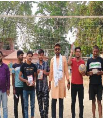
प्रतिनिधि चुनना चाहिए। आप अपने एक वोट से उस सही प्रत्याशी को

इस दौरान विद्यार्थी परिषद के कार्यकर्ता ने राष्ट्र प्रथम मतदान दिवस का पचा वितरण किया और मतदान के महत्व को समझाते हुए बताया कि आज भारत दुनिया का सबसे बड़ा लोकतंत्र है। प्रत्येक व्यक्ति को अपना मतधिकार का प्रयोग करना चाहिए अपनी मनपसंद की सरकार और अपना मनपसंद