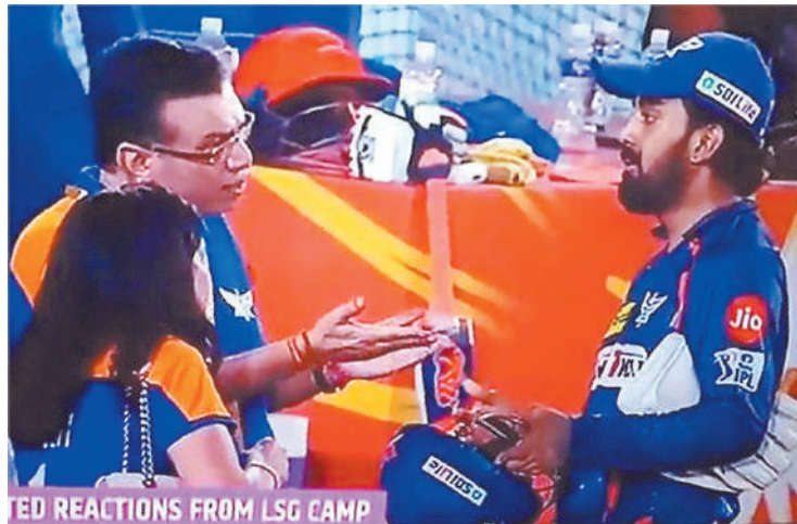
REACTIONS FROM LSG CAMP

हैदराबाद (एजेंसी)। आईपीएल के 2024 संस्करण में लखनऊ सुपर जाइंट्स के सनराइजर्स हैदराबाद से शर्मनाक हार के बाद फेंचइजी के मालिक संजीव गोयनका बेहद निराश दिखे और उन्होंने अपनी निराशा कप्तान केएल राहुल पर निकाली। अब सोशल मीडिया पर गोयनका के व्यवहार पर बहस छिड़ गई है। कोलकाता नाइट राइडर्स के खिलाफ 98 रन की हार झेलने के बाद अब बीती रात सनराइजर्स हैदराबाद ने 62 गेंद पहले लखनऊ सुपरजायंट्स को 10 विकेट से रौंद दिया। लगातार दो हार के बाद अब टीम की प्लेऑफ की उम्मीदों को कराया झटका लगा है। टूर्नामेंट ऐसे नाजुक मौके पर खड़ा है, जहां एक हार और खेल खत्म, वहां लखनऊ सुपरजायंट्स का ऐसा लचर प्रदर्शन देखकर टीम के मालिक संजीव गोयनका बुरी