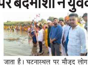
जाता है। घटनास्थल पर मौजूद लोग व चायल युवक ने बताया की गांव के