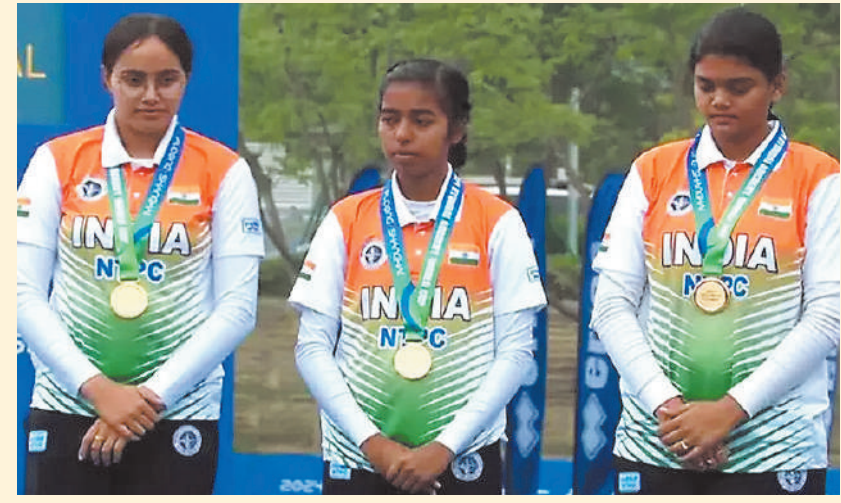
आर्ची वर्ल्ड कप