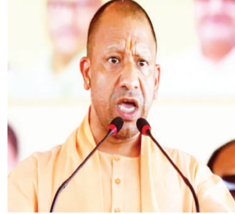
जिले के बिलारी में एक चुनावी रैली को संबोधित कर रहे थे।

लखनऊ, एजेंसी। उत्तर प्रदेश के मुख्यमंत्री योगी आदित्यनाथ ने शुक्रवार को कांग्रेस पार्टी पर बड़ा हमला बोला है। उन्होंने कहा है कि कांग्रेस अल्पसंख्यकों को गोमांस खाने का अधिकार देना चाहती है और यह गोहत्या की अनुमति देने के समान है। एक चुनावी सभा को संबोधित करते हुए योगी ने कहा, ये बेशर्म लोग गोमांस खाने का अधिकार देने का वादा करते हैं, जबकि हमारे ग्रंथ गाय को माता कहते हैं। वे गायों को कसाई के हाथों में सौंपना चाहते हैं। क्या भारत इसे कभी स्वीकार करेगा?