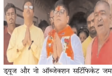
ड्यूज और नो ऑब्जेक्शन सर्टिफिकेट जमा