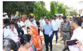
कर मतदान किया। इसके पूर्व 80 वर्षीय वृद्ध मतदाता ने भी मतदान किया था। इस क्रम में जिलाधिकारी ने कतार में लगे हुए मतदाताओं को होसला