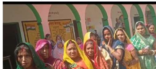
कर मतदान किया। इसके पूर्व 80 वर्षीय वृद्ध मतदाता ने भी मतदान किया था। इस क्रम में जिलाधिकारी ने कतार में लगे हुए मतदाताओं को होसला

शाहकुंड (भागलपुर)। लोकसभा आम चुनाव 2024 को लेकर निर्वाचन आयोग के निर्देशन में अपने पूर्व निर्धारित समय के तहत बांका लोकसभा के सुलतानगंज विधानसभा क्षेत्र में दूसरे चरण का मतदान सुबह सात बजे से प्रारंभ हो गया। मतदान को लेकर जिला पदाधिकारी सह जिला निर्वाचन पदाधिकारी के निर्देश पर सभी बुधों पर सुरक्षा व्यवस्था के मद्देनजर पुष्ता इंतजाम किये गए हैं, साथ पुरे शहर में एंव