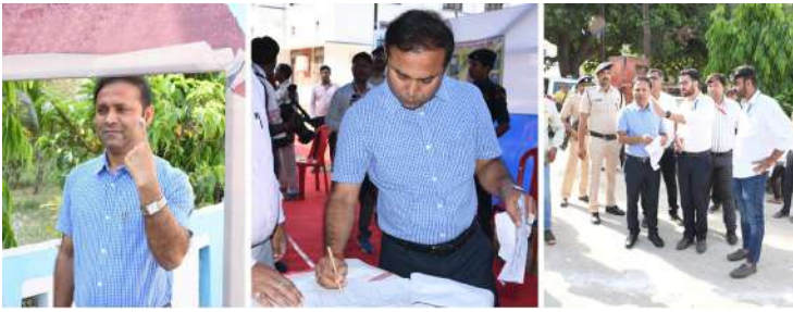
वार्मिंग को रोकने के लिए हम सबों को अधिक से अधिक पौधे लगाने की जरूरत है। उक्त दिशा में मतदान के अवसर पर आज मतदाताओं को हरित क्षेत्र में वृद्धि करने के लिए जिलाधिकारी

भागलपुर। लोकसभा आम निर्वाचन 2024 को स्वतंत्र, निष्पक्ष, शांतिपूर्ण एवं भय मुक्त वातावरण में संपन्न कराने व सतत प्रगतिशत मतदाताओं की भागीदारी सुनिश्चित करने को लेकर कई प्रकार की पहल की गई है। इसी कड़ी में जिला निर्वाचन पदाधिकारी सह जिला पदाधिकारी डॉ. नवल किशोर चौधरी द्वारा भागलपुर नगर के तीन मतदान केंद्रों को हरित मतदान केंद्र के रूप में चिन्हित किया गया है। जिसमें मतदान केंद्र संख्या 41, 48 और 85 को हरित बूथ के तौर पर बनाया गया है। वहीं जिलाधिकारी ने सभी हरित बूथों पर मतदाताओं को पौधा देकर प्रोत्साहित किया। उन्होंने कहा यह कॉन्सेप्ट पर्यावरण संतुलन के लिए रखा गया है। पर्यावरण संतुलन के लिए हरित क्षेत्र में वृद्धि आवश्यक है। निरंतर बढ़ते ग्लोबल