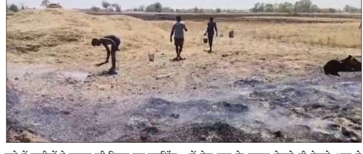
बारे में ग्रामीणों ने बताया की विद्युत तार स्पार्किंग की वजह से चिंगारी से आग लग गई और बाजार में तेज हवा के कारण देखते ही देखते आग ने भयावह रूप ले लिया।

प्रातः किरण संवाददाता रोहतास। रोहतास जिले के काराकाट में आग लगने से आधा दर्जन गाँवों के बंधार में लगे गेहूँ के फसल करीब डेढ़ सौ बीघा में जलकर खाक हो गया।