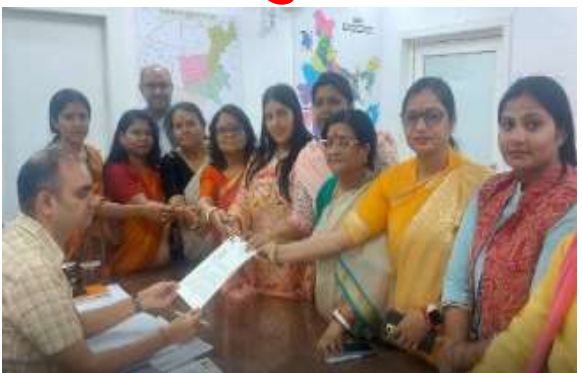
पटना, प्रातः किरण संवाददाता

जमुई लोकसभा क्षेत्र में राजद नेता तेजस्वी यादव की सभा में राजद लोजपा (रामविलास) प्रमुख चिराग पासवान के परिजनों को गाली देने की घटना को भाजपा प्रदेश अध्यक्ष सम्राट चौधरी ने पीड़ादायक बताते हुए भरोसा दिया है कि ऐसे लोगों पर कार्रवाई की जाएगी। पटना में गुरुवार को पत्रकारों से चर्चा करते हुए बिहार के उप मुख्यमंत्री चौधरी ने कहा कि देश के दलितों के मसीहा स्वर्गीय रामविलास